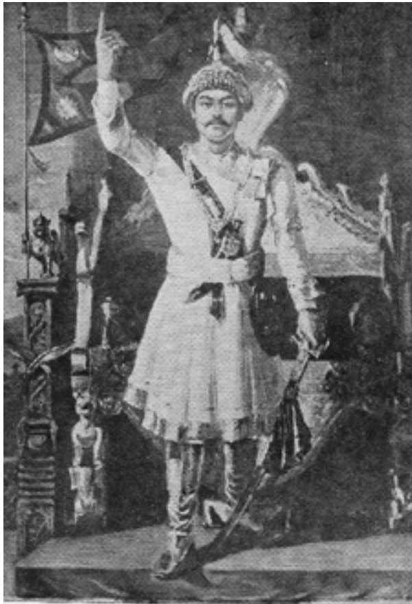
Портрет Прітхві Нараяна Шаха