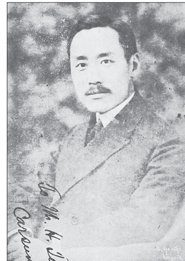
Рис. 1. Чжан Цзюньмай

Проникнення в Китай аналітичної філософії пов’язане з працями і педагогічною діяльністю англійського філософа Б. Рассела, який із жовтня 1920-го по липень 1921 року прочитав лекційні курси в Пекінському університеті: “Проблеми філософії”, “Аналіз матерії”, “Аналіз розуму”, “Соціальна структурологія”. Уявлення Б. Рассела про логіко-аналітичний метод філософії, його критика прагматистського розуміння істини Д. Дьюї та інтуїтивістської гносеології А. Бергсона, твердження об’єктивності джерела пізнання, емпіричної перевірки істинності і науково-доказового підходу до філософських проблем вплинули на філософське співтовариство Китаю. Уже в 1920-х роках у Китаї виникла філософська дискусія про науку (科学, kēxué ) і метафізику (玄学, xiánxué ), у ході якої “прихильники науки” (або “західники”) обстоювали необхідність розвитку Китаю відповідно до західних зразків, а “прихильники метафізики” під враженням від руйнівних наслідків Першої світової війни твердили про кризу “матеріалістичної” західної культури, віддаючи пріоритет “духовності” Сходу. Імпульсом для початку дискусії стала лекція “Світогляд” (“人生观”, “ Rénshēng guān ”) відомого китайського філософа Чжан Цзюньмая (张君勱, 1886–1969), прочитана ним у лютому 1923 року в Пекінській школі Цінхуа (згодом – це Університет Цінхуа). Чжан Цзюньмай, погляди якого сформувалися під сильним