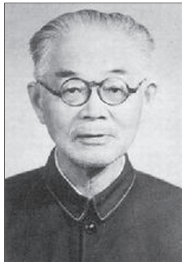
Рис. 4. Чжан Дайнянь

Дискусія про науку і метафізику мала важливе значення для загальної постановки питання про місце науки в модернізації китайського суспільства, а також відбувся суттєвий вплив сцієнтизму та позитивізму на традиційну китайську філософію. Цю дискусію вважають першим конфліктом між аналітичною філософією і традиційною китайською філософією, яка на той момент взяла гору. Однак, як відзначають Цзян І і Бай Тундун, аналітична філософія не зникла в Китаї, а стала новою філософською теорією [Jiang Yi 2009, 4]. Деякі китайські філософи навіть намагалися використовувати методологію аналітичної філософії для вивчення і розвитку традиційної китайської філософії. На цьому етапі вони займалися поширенням і вивченням аналітичної філософії. Наприклад, у 1927 році один з головних засновників Комуністичної партії Китаю, політичний діяч, філософ і математик Чжан Шеньфу (张申府, 1893–1986) переклав та опублікував “Філософський трактат” Вітгенштейна (“名理论”, “Mínglǐ lùn”, який зараз прийнято перекладати “逻辑哲学论”, “Luójí zhéxué lùn”). Чжан Шеньфу був не тільки першим і надалі провідним фахівцем з вивчення філософії Б. Рассела в Китаї, а й створив власну концепцію, в основі якої лежить поняття “чистого об’єктивізму” (“纯客观论”, “chún kèguān lùn”), що базується на незвичайному поєднанні “гуманізму” Конфуція і “наукового методу” Б. Рассела – “двох найважливіших цінностей світу”, на думку філософа [张申府 1931, 2].