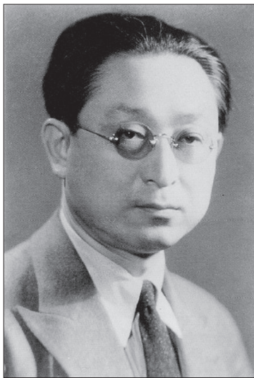
Рис. 3. Чжан Шеньфу

Дискусія про науку і метафізику мала важливе значення для загальної постановки питання про місце науки в модернізації китайського суспільства, а також відбувся суттєвий вплив сцієнтизму та позитивізму на традиційну китайську філософію. Цю дискусію вважають першим конфліктом між аналітичною філософією і традиційною китайською філософією, яка на той момент взяла гору. Однак, як відзначають Цзян І і Бай Тундун, аналітична філософія не зникла в Китаї, а стала новою філософською теорією [Jiang Yi 2009, 4]. Деякі китайські філософи навіть намагалися використовувати методологію аналітичної філософії для вивчення і розвитку традиційної китайської філософії. На цьому етапі вони займалися поширенням і вивченням аналітичної філософії. Наприклад, у 1927 році один з головних засновників Комуністичної партії Китаю, політичний діяч, філософ і математик Чжан Шеньфу (张申府, 1893–1986) переклав та опублікував “Філософський трактат” Вітгенштейна (“名理论”, “Mínglǐ lùn”, який зараз прийнято перекладати “逻辑哲学论”, “Luójí zhéxué lùn”). Чжан Шеньфу був не тільки першим і надалі провідним фахівцем з вивчення філософії Б. Рассела в Китаї, а й створив власну концепцію, в основі якої лежить поняття “чистого об’єктивізму” (“纯客观论”, “chún kèguān lùn”), що базується на незвичайному поєднанні “гуманізму” Конфуція і “наукового методу” Б. Рассела – “двох найважливіших цінностей світу”, на думку філософа [张申府 1931, 2].