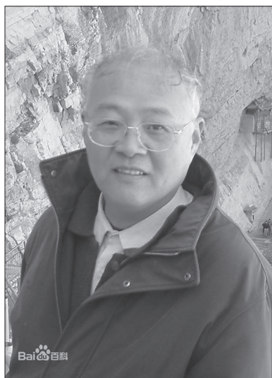
Рис. 9. Чжао Дуньхуа

У Китаї спостерігається істотний прогрес у розвитку ключового напрямку для аналітичної традиції – філософії мови , – повноцінне вивчення і розвиток якого розпочалися після появи двотомного дослідження “Аналітична філософія та її розвиток у США” Ту Цзіляна (涂纪亮, 1926–2012) [涂纪亮 1987]. Крім того, Ту Цзілян виступив редактором збірки найважливіших творів англо-американської філософії мови за останні десятиліття [涂纪亮编 1988], керівником перекладу на китайську мову зібрання творів У. Куайна “蒯因著作集” в 6 томах [涂纪亮等 2007], найповнішого у світі зібрання праць Л. Вітгенштейна у 12 томах (6 із яких він переклав сам) [涂纪亮等 2003], а також написав фундаментальне дослідження “Філософські думки Вітгенштейна” (“维特根斯坦后期哲学 思想研究”) [涂纪亮 2005]. Ту Цзілян наполягає на тому, що філософію мови слід розглядати як самостійний напрям філософії, представлений різними школами в різних традиціях думки. При цьому у своїх монографіях “Англо-американська філософія мови” (“英美语言哲学”) [涂纪亮 1993] і “Сучасна континентальна філософія мови” (“现代欧洲大陆语言哲学”) [涂纪亮编 1994] на основі порівняльного аналізу Ту Цзілян виділяє загальні для них підходи: 1) мова – це предмет