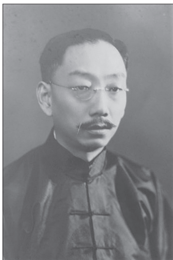
Рис. 2. Дін Венцзян

ли на філософське співтовариство Китаю. Уже в 1920-х роках у Китаї виникла філософська дискусія про науку (科学, kēxué ) і метафізику (玄学, xiánxué ), у ході якої “прихильники науки” (або “західники”) обстоювали необхідність розвитку Китаю відповідно до західних зразків, а “прихильники метафізики” під враженням від руйнівних наслідків Першої світової війни твердили про кризу “матеріалістичної” західної культури, віддаючи пріоритет “духовності” Сходу. Імпульсом для початку дискусії стала лекція “Світогляд” (“人生观”, “ Rénshēng guān ”) відомого китайського філософа Чжан Цзюньмая (张君勱, 1886–1969), прочитана ним у лютому 1923 року в Пекінській школі Цінхуа (згодом – це Університет Цінхуа). Чжан Цзюньмай, погляди якого сформувалися під сильним