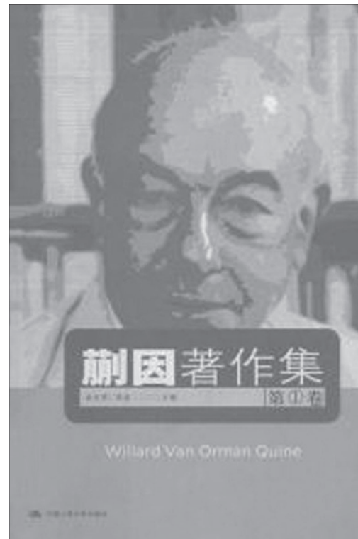
Рис. 12. Обкладинка 6-томного зібрання творів У. Куайна в перекладі на китайську мову

Низка важливих досліджень були виконані представниками нового покоління китайських філософів, які спеціалізуються на вивченні аналітичного напрямку, – це роботи Сюй Ююя “Коперніканська революція, лінгвістичний поворот у філософії” («“哥白尼式”的革命 – 哲学中的语言转向») [徐友渔 1994], Цзян І “Вітгенштейн: постфілософська культура” (“维特根斯坦:一种后哲学文化”) [江怡 1996], Чень Бо “Дослідження філософії Куайна з логічної та лінгвістичної перспективи” (“奎因哲学研究: 从逻辑和语言的观点看”) [陈波 1998], Чень Яцзюня “Прагматизм: від Пірса до Патнема” [陈亚军 1999] та ін. Аналітичний підхід використовується в роботі Фен Яоміна “Методологічні проблеми китайської філософії” (“中国哲学的方法论问题”) [冯耀明 1989].