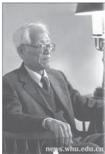
Рис. 7. Цзян Тяньцзі

У цей період контакти із західними вченими були можливі тільки для тих китайських вчених, які жили на Тайвані, острові, який не увійшов до складу Китайської Народної Республіки і до сьогоднішнього дня залишається “осколком” громадянського конфлікту, що тривав протягом 1920–1940-х років.