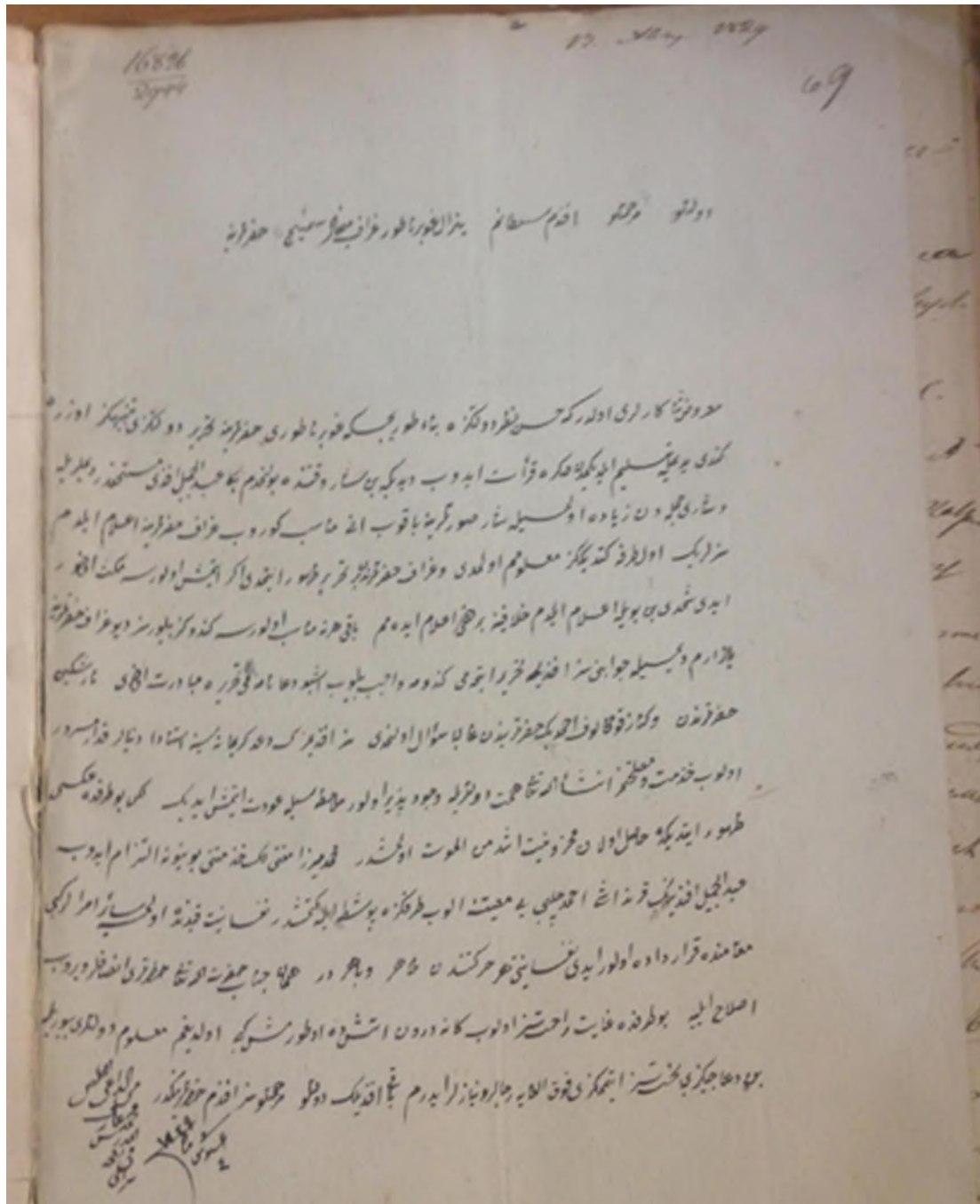
Іл. 1. Лист бахчисарайського мудерріса Аріфа Мегмета ефенді до графа М. С. Воронцова від 4 серпня 1829 року