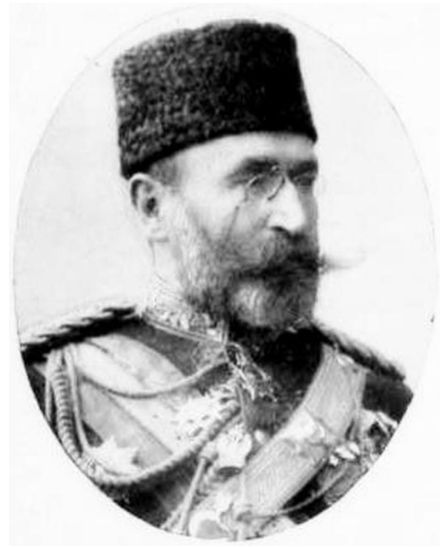
Іл. 3. Новопризначений мутасарріф (губернатор) Лівану Музаффер Еддін Паша. [Sixth annual report... 1904, 16]