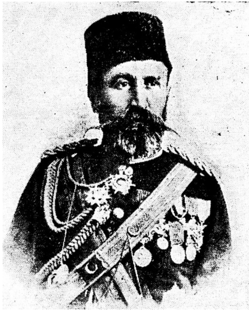
Іл. 2. Музаффер-паша під час офіційного візиту султана Абдул-Гаміда II до Софії, 1896 р. [Стойчев 1943, 193]