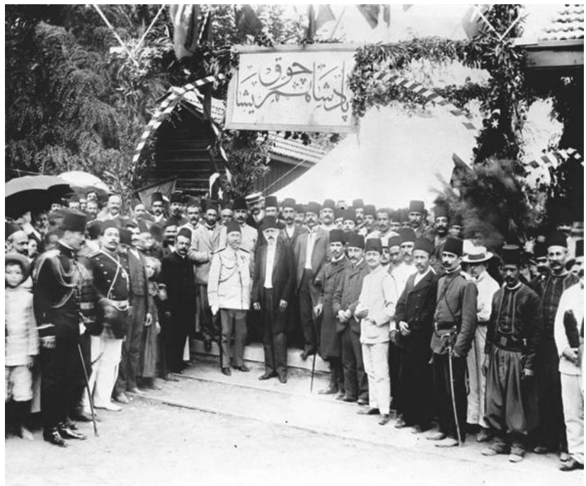
Іл. 4, 5. Мутасарріф Лівану Музаффер-паша на зустрічі з делегацією на станції Аліє перед офіційною церемонією відкриття залізниці Дамаск – Маан, 1905 р. [Photo exhibition...]