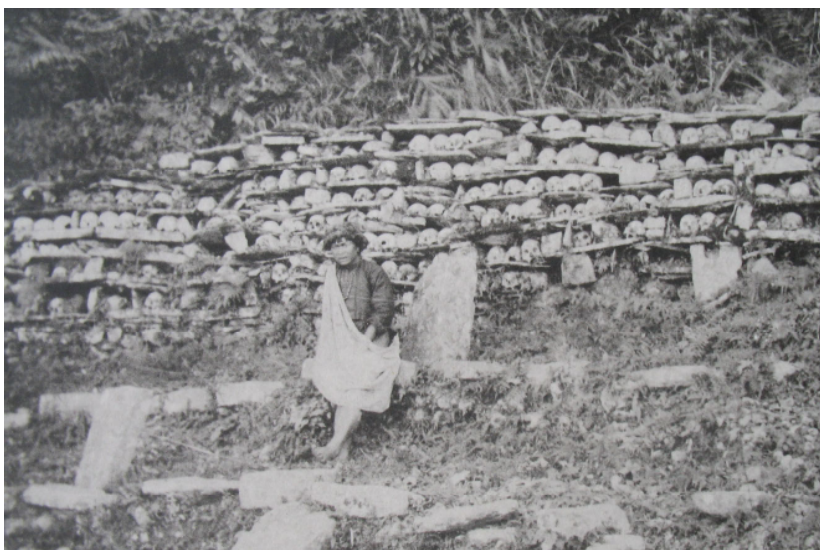
Мал. 3. Плем'я рукаї. Родова полиця з черепами. Експедиція Р. Торії. 1899 р.