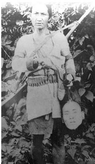
Мал. 4. Плем'я бунун. Мисливець за головами з трофеєм.