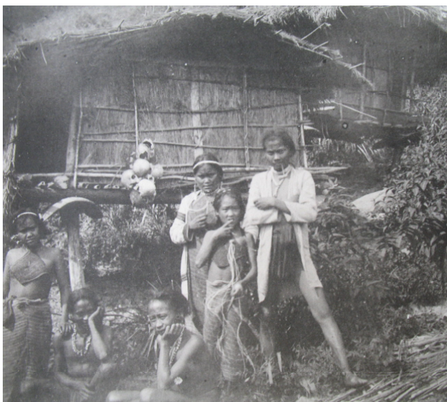
Мал. 5. Плем'я східні атаял. Черепи-обереги обійстя. Експедиція Р. Торії. 1896 р.