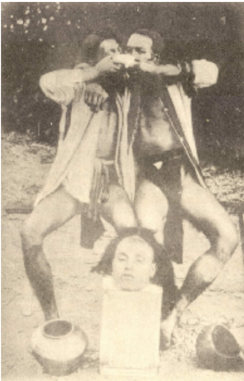
Мал. 1. Плем'я атаял. Мисливці за головами. Братання кров'ю. Експедиція А. Мольтрехта. 1908–1909 рр.