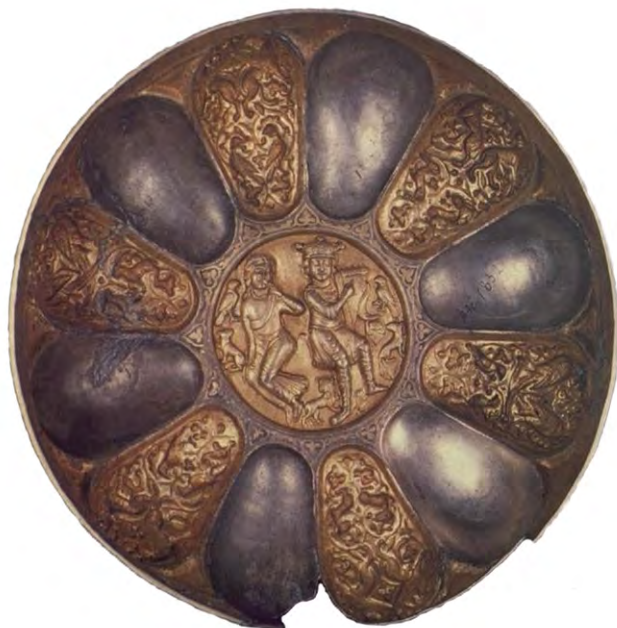
Мал. 8. Срібна чаша зі знахідок 1957 р. в Чернігові (за: [Даркевич 1975, 18])

Проаналізувавши детально зовнішній вигляд персонажів на зображенні та загальну композицію, В. Даркевич висунув гіпотезу, що на чаші зображено не Давида та Мелодію, а інші відомі в середньовічному мистецтві постаті – Дигеніса та Євдокію [Даркевич 1975, 135]. Про це, на його думку, свідчить кардинальна зміна зовнішнього вигляду головних героїв – легке драпування змінено одягом середньовічного крою, античну ліру в руках витіснила середньовічна арфа, відсутні німби, а отара овець та кіз, що мирно випасається поруч, замінена левами, вовками та зайцями. Все це надає зображенню, на погляд дослідника, світський колорит, і в такий спосіб образ молодого біблійного пастуха, що “випасає овець батька свого”, перетворюється на епічного героя [Даркевич 1975, 133]. В. Даркевич порівнює зображення на чаші з поемою про Дигеніса Акрита, знаходить низку збігів і засвідчує його більшу схожість із постатями Дигеніса та Євдокії [Даркевич 1975, 135–139].