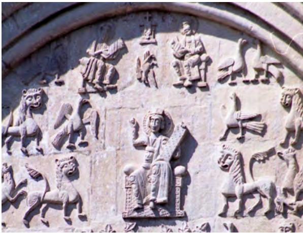
Мал. 4. Зображення царя Давида на рельєфі Дмитріївського собору у Володимирі

У трьох центральних тимпанах фасадів – західного, східного та південного – Дмитріївського собору у Володимирі також вміщена персоніфікована фігура молодого царя-пророка на троні (мал. 4). Юнака оточують птахи, леви та грифони, що тримають ланей у лапах. У 1998–1999 рр. під час реставрації рельєфного зображення на південному фасаді храму було виявлено напис “АГ ДДД”, що засвідчило: особа на рельєфах – справді саме цар Давид [Новаковская-Бухман 2002, 174].