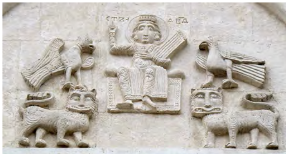
Мал. 3. Зображення царя Давида на рельєфі церкви Покрова на Нерлі

У центральних закомарах північного, південного та західного фасадів церкви Покрова на Нерлі розташовано три однакові композиції з різного каменю – це зображення царя Давида на троні в оточенні парних скульптур левів та голубів. Зверху над кожним з рельєфів міститься напис “СТЪ Д [А] В [И] ДЪ”, що означає “Святий Давид”. Цар постає в образі юнака, який урочисто сидить на престолі (мал. 3). Правою рукою він благословляє, а лівою притискає до тулуба прямокутний п’ятиструнний музичний інструмент, подібний до давньогрецького псалтерія вертикального тримання.