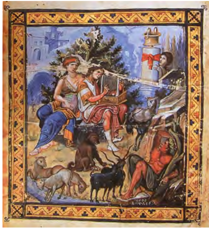
Мал. 2. Зображення царя Давида на мініятурі Паризького Псалтиря (gr. 139)

У центральних закомарах північного, південного та західного фасадів церкви Покрова на Нерлі розташовано три однакові композиції з різного каменю – це зображення царя Давида на троні в оточенні парних скульптур левів та голубів. Зверху над кожним з рельєфів міститься напис “СТЪ Д [А] В [И] ДЪ”, що означає “Святий Давид”. Цар постає в образі юнака, який урочисто сидить на престолі (мал. 3). Правою рукою він благословляє, а лівою притискає до тулуба прямокутний п’ятиструнний музичний інструмент, подібний до давньогрецького псалтерія вертикального тримання.