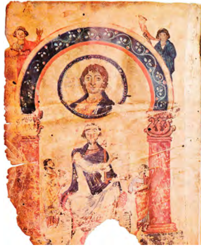
Мал. 1. Зображення царя Давида на мініатюрі Хлудівського Псалтиря (греч. 129-д) (за: [Лихачева 1977, 26])

У Паризькому Псалтирі (гг. 139) 2 , що датується різними авторами в діапазоні від середини IX ст. [Лазарев 1986, 69] до першої половини X ст. [Даркевич 1975, 132], на одній з мініатюр зображено царя Давида, що грає на струнному інструменті ( мал. 2 ). Поруч із ним розташувалися невелика отара овець та собака. За його спиною сидить жінка, поруч із якою написано “МЕЛОДІА”. Однозначно класифікувати інструмент у руках царя Давида неможливо. В. Петров називає його десятиструнною лірою, що являє собою прямокутну раму зі струнами. Також дослідник відзначає, що сама ліра має коробку-резонатор, щодо якої вона розміщена неначе кришка рояля. Між лірою та коробкою наявна підпірка, яку Давид тримає лівою рукою [Петров 2010, 700]. Однак однозначно погодитися з цими висновками В. Петрова не можна. На зображенні