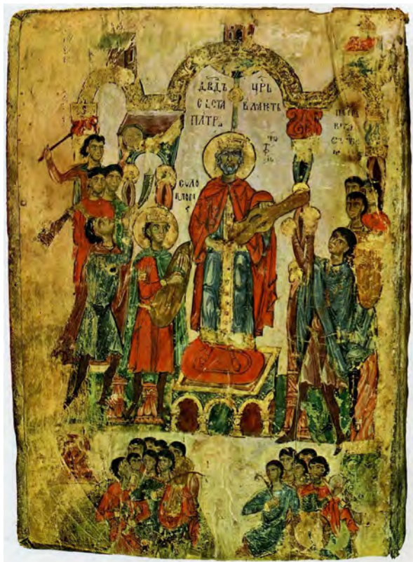
Мал. 6. Зображення царя Давида на мініатюрі Хлудівського (Симоновського) Псалтиря (Хлуд. 3) (за: [Porova 1975, 55])

Найімовірніше, зображений на мініатюрі Хлудівського Псалтиря музичний інструмент є гудком – інструментом, що побутував у Середньовіччі у Східній Європі. Знахідки гудків та їхніх фрагментів різного ступеня збереженості, що зафіксовані в цьому регіоні, датуються XI – другою половиною XIV ст. [Колчин 1968, 67]. Назву “гудок” мав смичковий інструмент із корпусом овальної форми без бічних виїмок. На інструменті був відсутній спеціальний гриф. На верхній деці іноді зустрічалися резонансні отвори у вигляді напівкруглих дужок, однак у більшості випадків вони відсутні. Під час гри гудок тримали у вертикальному