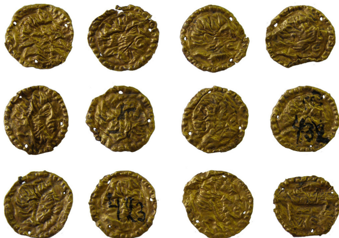
Мал. 1. Пластинки із зображенням бородатої чоловічої голови в профіль вправо.