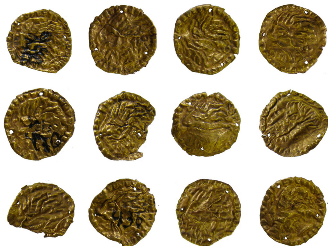
Мал. 2. Пластинки із зображенням бородатої чоловічої голови в профіль вліво.