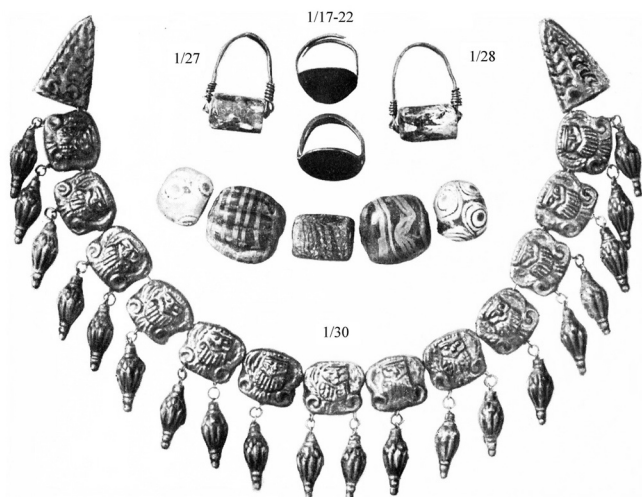
Мал. 4. Фотографія знахідок із Першого Мордвинівського кургану (за [Лесков 1974, рис. 40 ]) із зазначенням облікових номерів інвентарної книги Державного Ермітажу