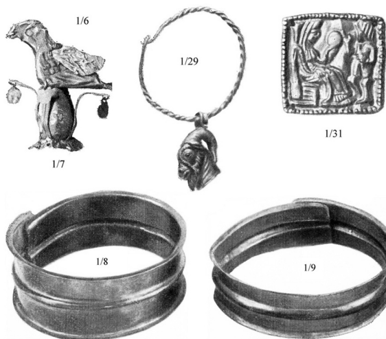
Мал. 5. Фотографія знахідок із Першого Мордвинівського кургану (за [Лесков 1974, рис. 37, 39, 41, 42 ]) із зазначенням облікових номерів інвентарної книги Державного Ермітажу (без масштабу)