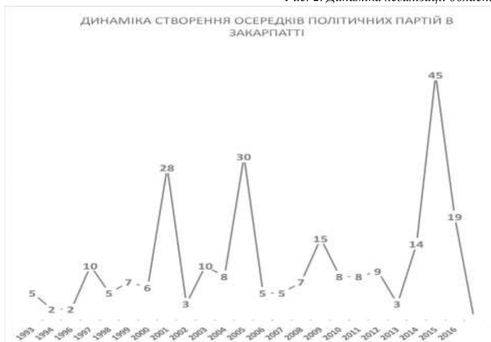
Рис. 2. Динаміка легалізації обласних осередків політичних партій

Найбільша кількість обласних осередків політичних партій легалізується в Закарпатській області напередодні загальнонаціональних виборів – парламентських і президентських (2001, 2005 та 2015 рр.). На нинішній час в Україні зареєстровано 354 політичні партії, що є одним із найбільших показників у Європі [9]. За даними Єдиного реєстру громадських формувань упродовж 2017 р. в Україні було зареєстровано лише три нові політичні партії, тобто процес партіотворення дещо призупинився. Аналогічною є ситуація і на Закарпатті.