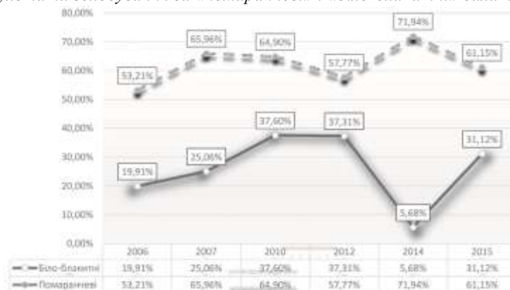
Рис. 1. Результати голосування за «помаранчеві» і «біло-блакитні» сили на виборах 2006–2014 рр. у

Таким чином, якщо до виборів 2004 р. соціокультурний поділ хоч і позначався на результатах виборів (парламентських і президентських), проте був одним із чинників структурування партійної системи, то під час президентської виборчої кампанії 2004 р. він набув характеру головного чинника впливу на її конфігурацію. Відтак, на нашу думку, доцільним буде показати як за вказані політичні сили голосували виборці Закарпаття на виборах 2006–2014 рр. Результати такого підрахунку подані на Рис. 1. Вони показують, що «біло-блакитні» сили нарощують свій потенціал до максимуму в 2012 р., а потім отримують мінімальний результат за результатами парламентських виборів 2014 р. На місцевих виборах 2015 р. уже в переформатованому вигляді вони знову отримують доволі високий результат.