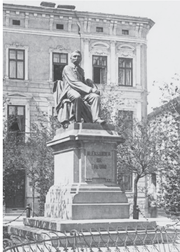
Іл. 7. Л. Марконі. Пам'ятник А. Фредро у Вроцлаві (перенесено зі Львова). 1897