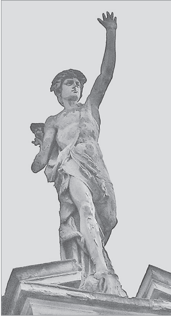
Іл. 3. Л. Марконі. Статуя Меркурія на аттику будинку по вул. Січових Стрільців, 3у Львові. 1887