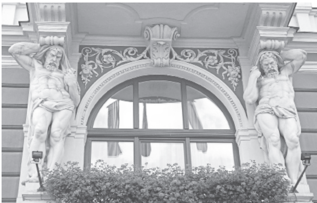
Іл. 6. Л. Марконі. Атланти на фасаді «Гранд-готелю» у Львові. 1893