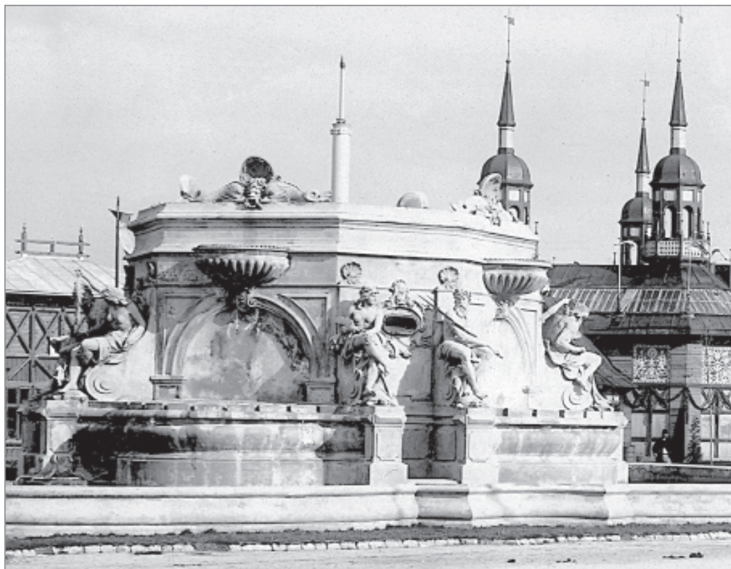
Іл. 8. Л. Марконі. Фонтан на Галицькій крайовій виставці у Львові. 1894