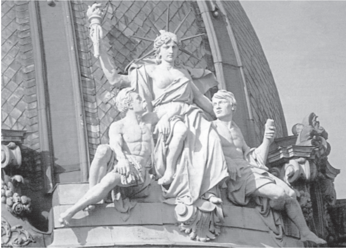
Іл. 5. Л. Марконі. Група «Ощадність, промисловість та рільництво» на аттиці Галицької ощадної каси у Львові. 1891