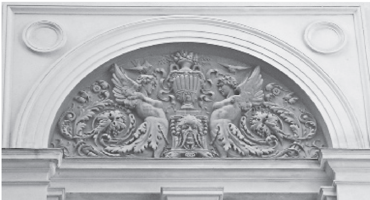
Іл. 2. Л. Марконі. Рельєф на зовнішній стіні зали засідань Галицького сейму. 1879