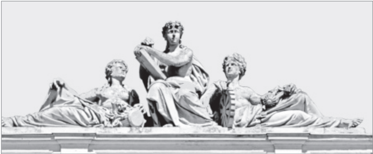
Іл. 1. Л. Марконі. Група «Інженерна наука, архітектура та механіка» на аттику головного будинку Львівської політехніки. 1876