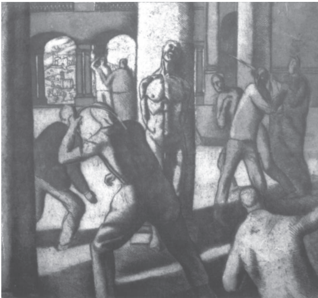
Л. Копельман. Бичування Христа. Кінець 1920-х рр. Офорт. ЧХМ