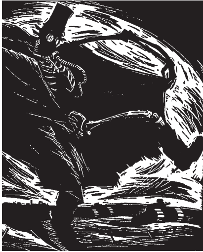
А. Кольнік. Під циліндром. Танець. 1934 р. Дереворит