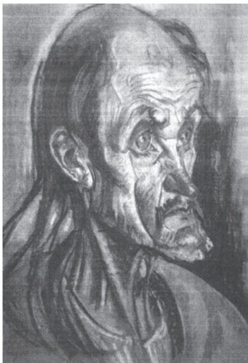
Г. Льовендаль. Старий буковинський селянин. 1936 р. Полотно, олія