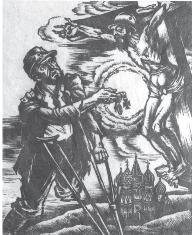
Л. Копельман. Хрести. 1936 р. Дереворит. ЧХМ