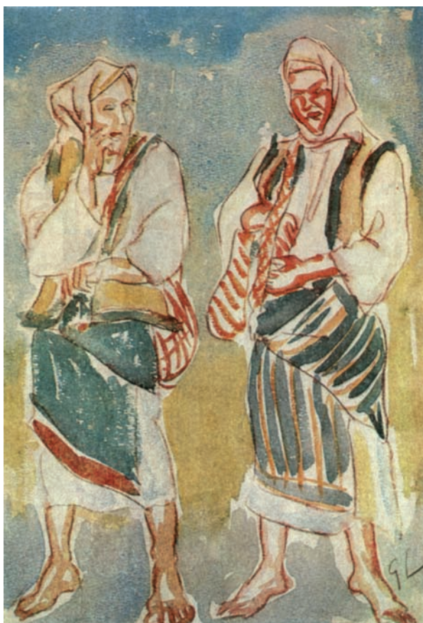
Г. Льовендаль. Площа. 1936 р. Акварель, пастель