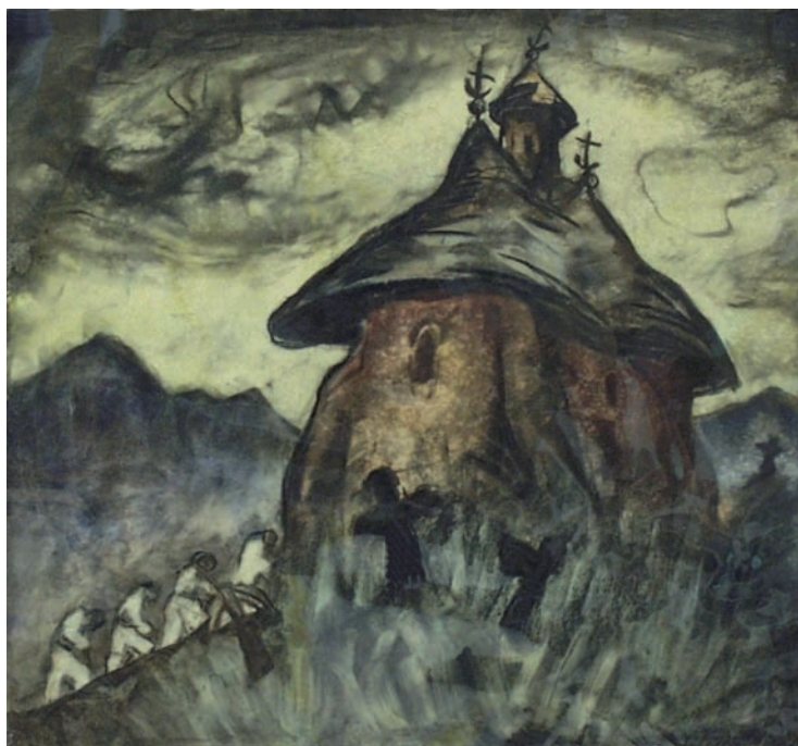
В. Загородніков. Карпати. 1934 р. Папір на картоні, пастель