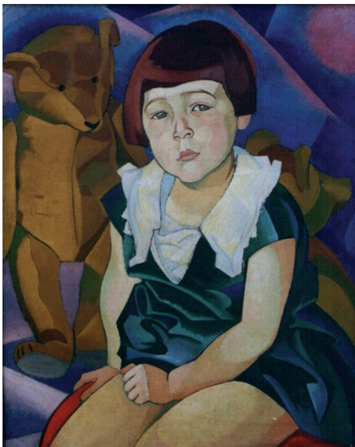
А. Кольнік. Дівчина з ведмедиками. 1925 р. Полотно, олія. ЧХМ