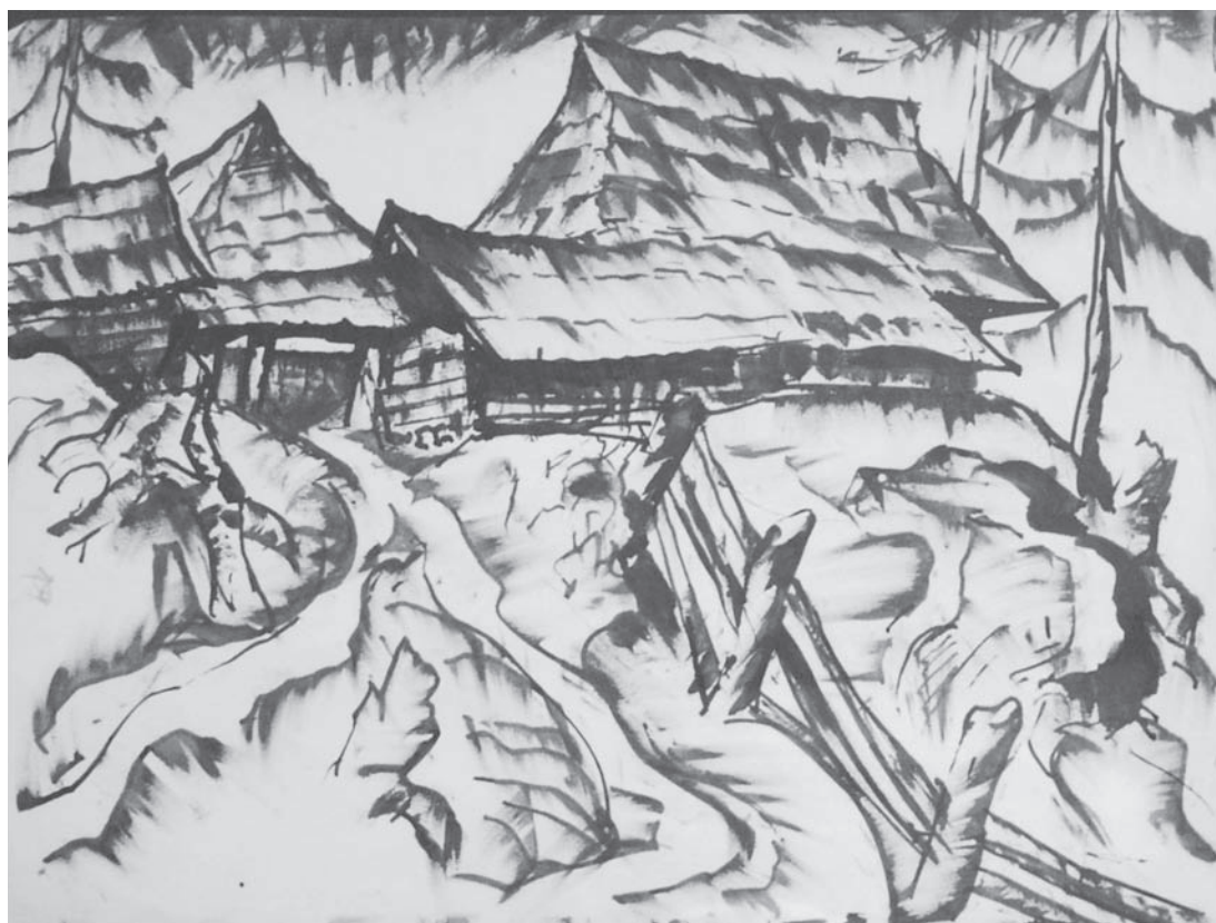
В. Загородніков. Карпатський краєвид. 1936 р. Папір, туш