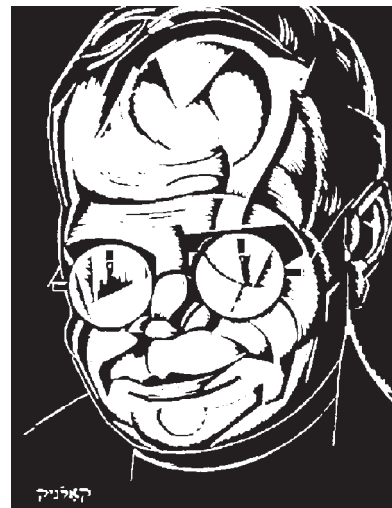
А. Кольнік. Ілюстрація до книги Е. Штейнбарга «Байки». 1928 р. Дереворит