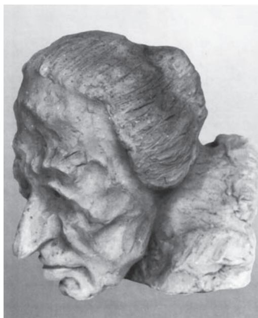
О. Шевчукевич. Освідчення. 1927 р. Теракота