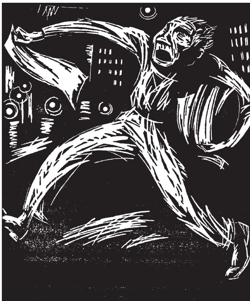
А. Кольнік. Під циліндром. Спецвипуск. 1934 р. Дереворит