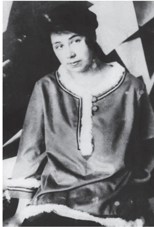
Любов Попова в майстерні. Москва. 1919 р.