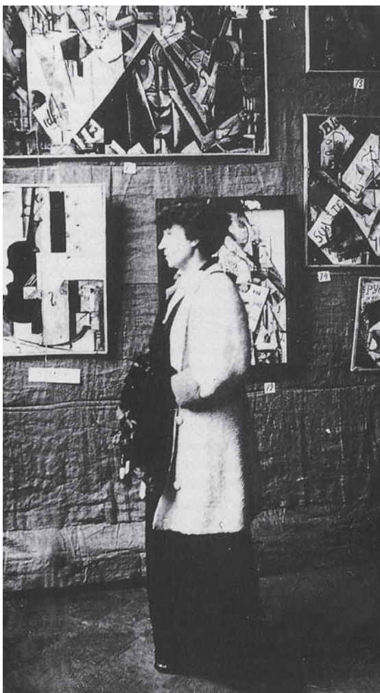
Олександра Екстер на виставці «Магазин». Москва. 1916 р.