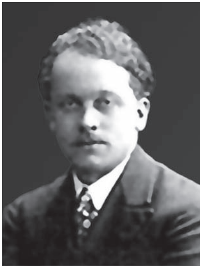
Рауль Дюфі. 1910-і рр.