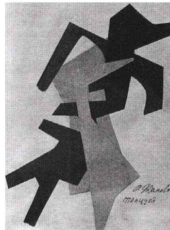
О. Розанова. Колаж. 1917–1918 рр. Папір, аплікація, туш. Приватна збірка