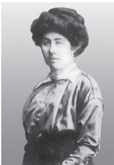
Анастасія Семиградова. 1910-і рр.