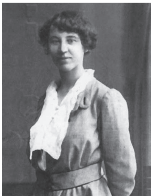
Євгенія Прибильська. 1910-і рр.