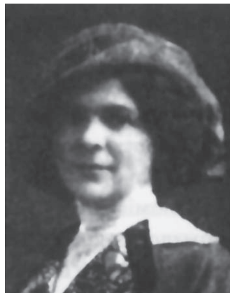
Наталя Давидова. 1910-і рр.