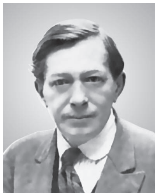
Яків Тугендхольд. 1920-і рр.