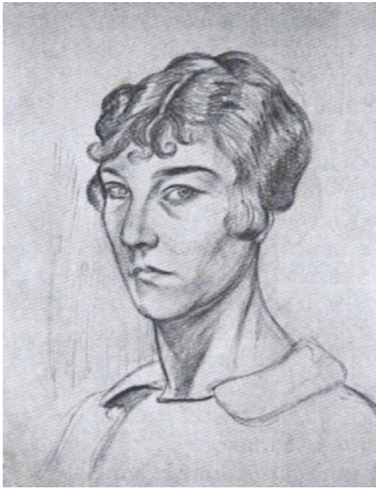
О. Розанова. Автопортрет. Папір, сангіна. 1917 р. Приватна збірка