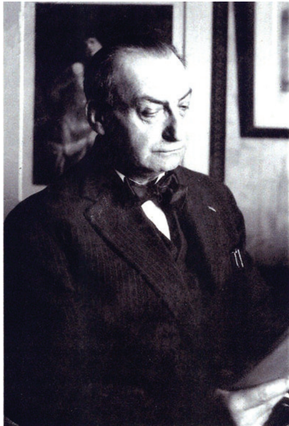
Шарль Дюфрен. 1930-і рр.