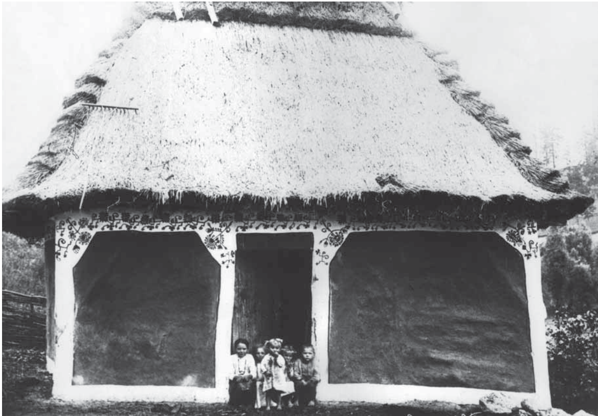
Розписаний хлів. 1924 р. с. Маків Кам'янецького пов. Подільської губ. (нині – Хмельницька обл.). ІР НБУВ, ф. 278, спр. 473, арк. 502