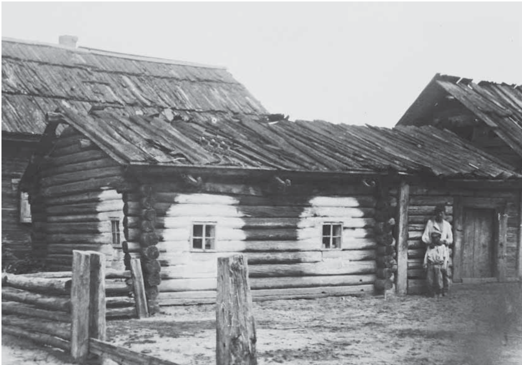
Малювання навколо вікон. 1928 р. с. Хочин Олевського р-ну (нині – Житомирська обл.). ІР НБУВ, ф. 278, спр. 498, арк. 340