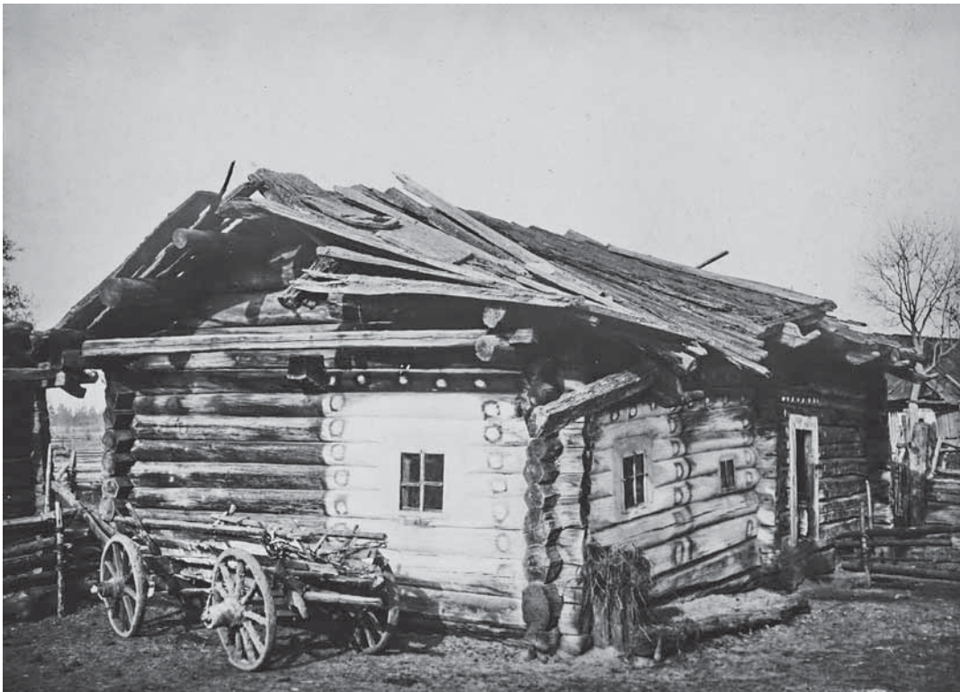
Малювання навколо вікон. 1928 р. Хутір Мацьки Словечанського р-ну (нині – Житомирська обл.). ІР НБУВ, ф. 278, спр. 498, арк. 207