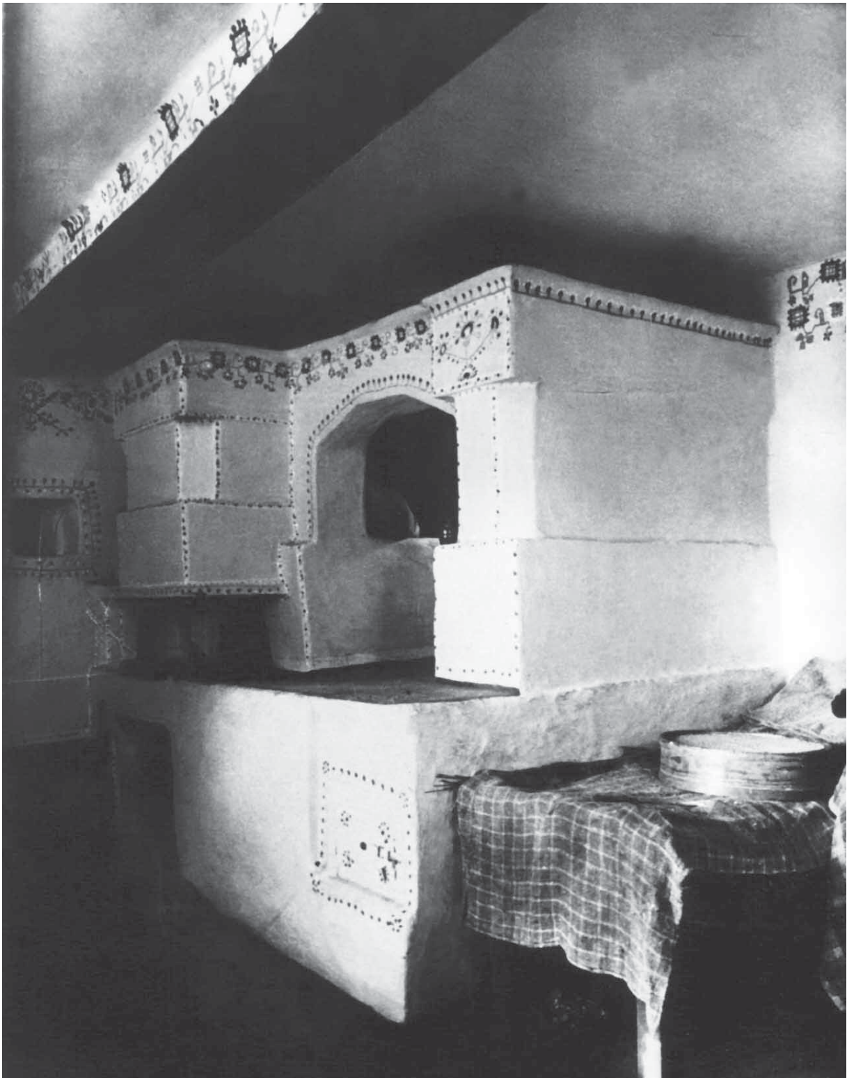
Мальовані піч та сволок. 1924 р. с. Маків Кам'янецького пов. Подільської губ. (нині – Хмельницька обл.). ІР НБУВ, ф. 278, спр. 473, арк. 507