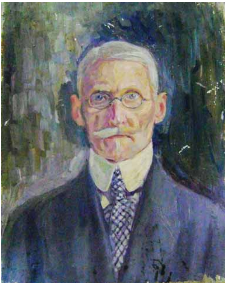
Г. Павлуцький. Автопортрет. 1910-ті рр. НХМУ