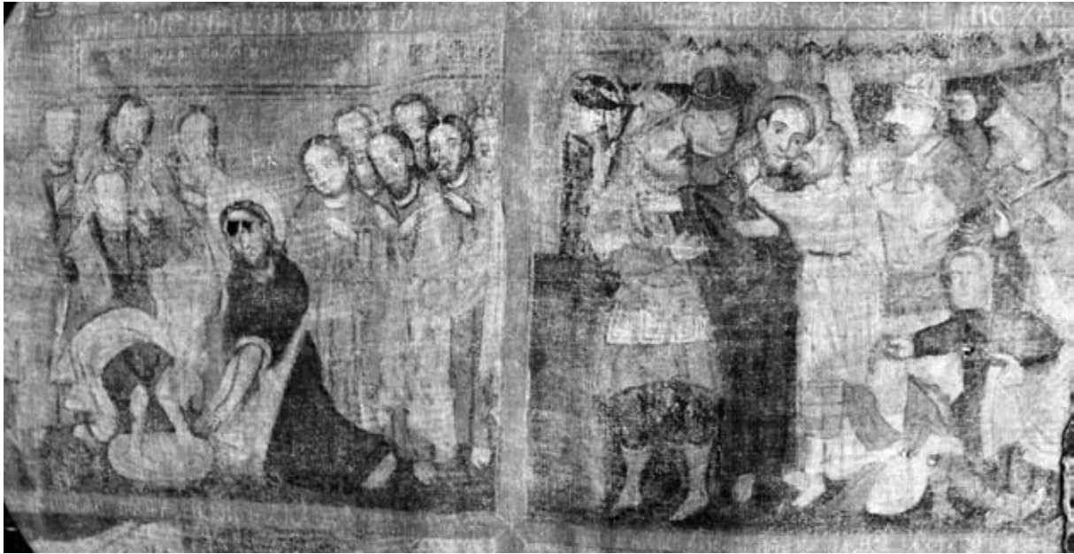
▲ Ікона «Страсті Христові» (фрагмент). 1670-ті рр. Із церкви с. Волиця-Деревлянська Буського р-ну Львівської обл. Полотно, темпера