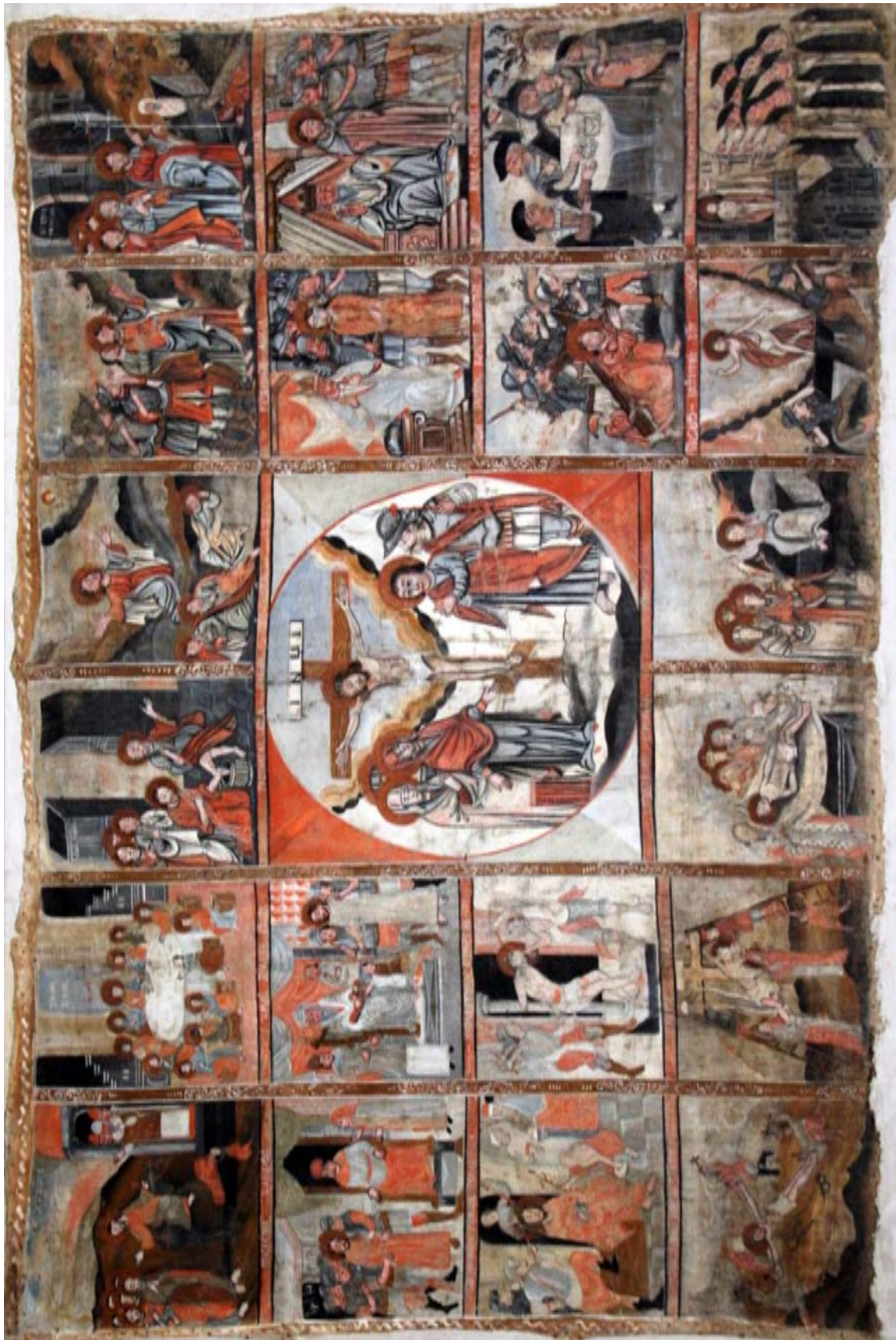
Ікона «Страсті Христові». Кінець XVII – перша третина XVIII ст. Із церкви с. Красів Миколаївського р-ну Львівської обл. Полотно, темпера