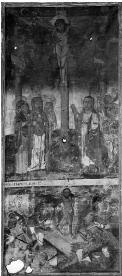
Могильницький Р. (?). Ікона «Страсті Христові». 1675 р. Із церкви м. Кам'янки-Бузької Львівської обл. Полотно, темпера, олія