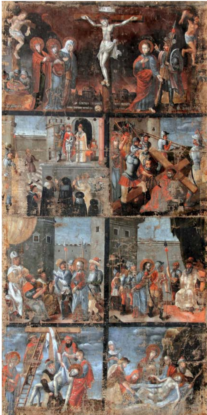
Домарацький М. Ікона «Страсті Христові». 1673 р. Із церкви м. Кам'янки-Бузької Львівської обл. Полотно, темпера, олія