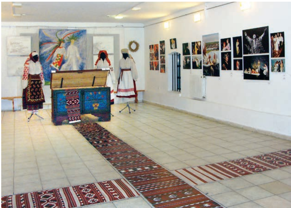
Фрагмент експозиції виставки: зала «Життя. Витоки» *