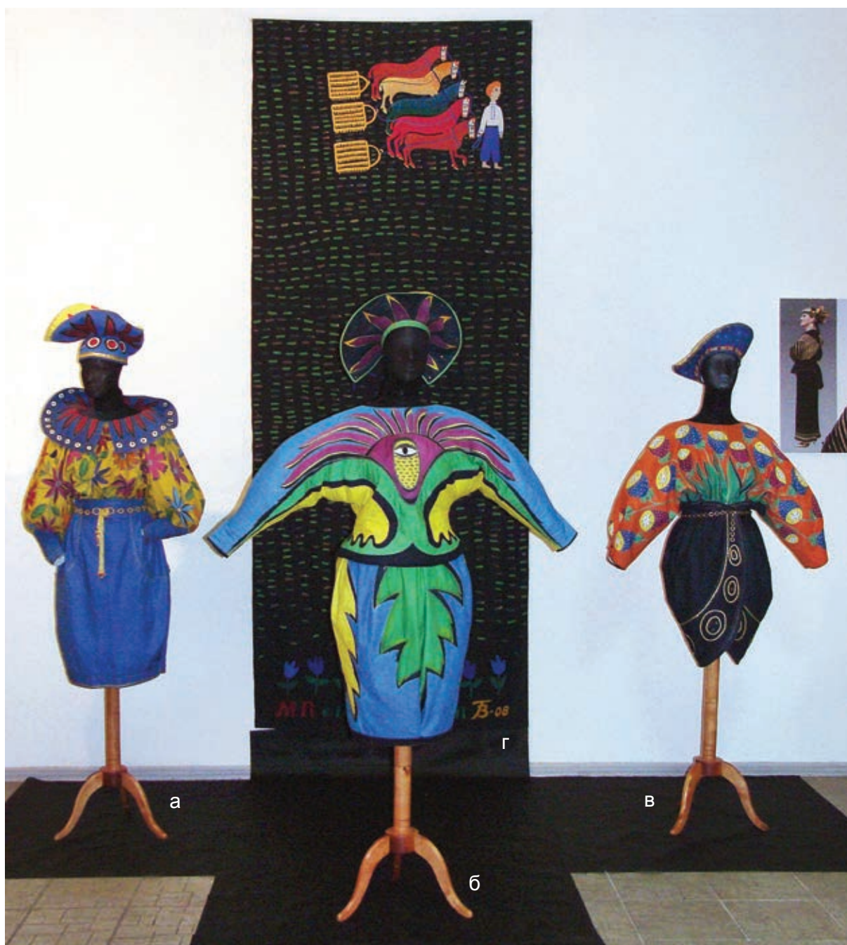
Г. Забашта. Поліптих за мотивами творів М. Приймаченко (костюми: а – «Букет», б – «Будяк», в – «Маки». 1989 р., бавовна, холодний батик, стебнування; панно: г – «Сіяч». 2008 р., бавовна, шовк, текстильна аплікація). Колекція автора