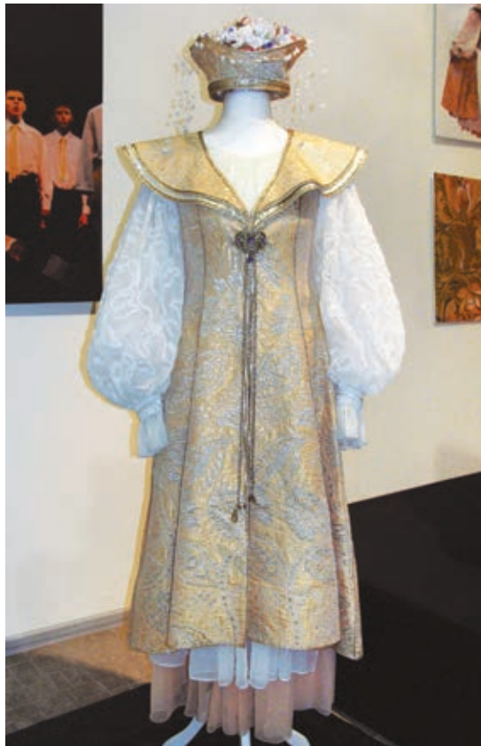
Г. Забашта. Костюм «Лілея». 2004 р., парча, шифон. НМУНДМ