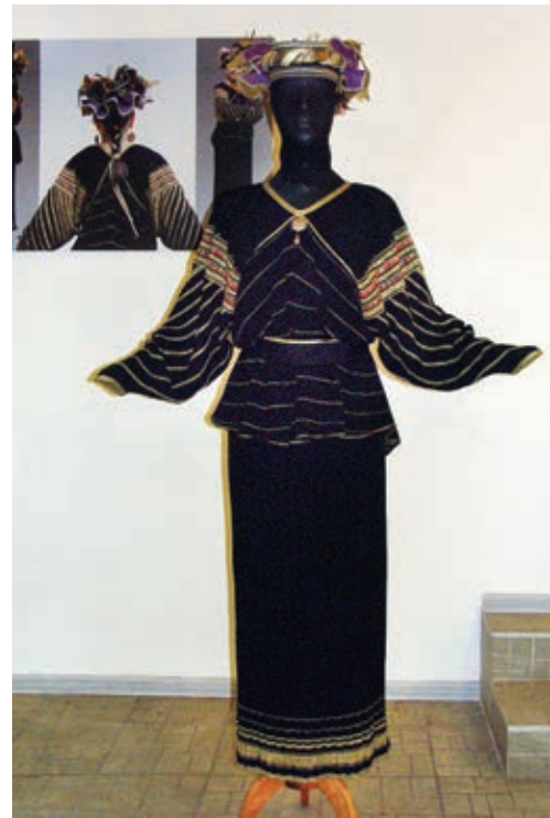
Г. Забашта. Костюм «Купальський дивоцвіт». 1988 р., трикотаж, віскоза, вовна, люрекс, шовк, парча. НМУНДМ