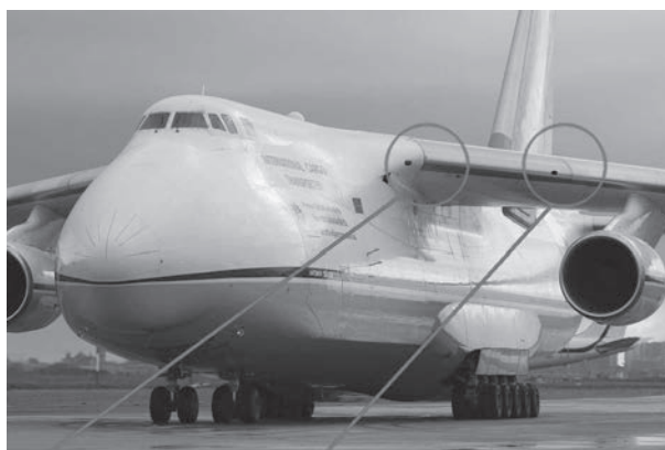
След от удара птицы

Другим ярким примером нетрадиционного испытания авиатехники с применением пенетрантов может служить технология определения расположения начальных очагов коррозии под ЛКП. Особенно актуальна такая задача при эксплуатации морской авиации. Когда «летающая лодка» садится на морскую поверхность, механические удары большой интенсивности воздействуют на поверхность самолета одновременно с коррозионным воздействием морской соленой воды. Такой синергический эффект рано или поздно приводит к развитию коррозии под защитным ЛКП. И для практики эксплуатации крайне важно выявлять начальные очаги коррозионного поражения. При решении данной задачи нами был использован химический метод, который заключался в следующем. Любое защитное ЛКП в той или иной степе-