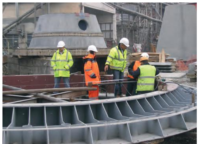
Проведення діагностики зварних з'єднань на Подільському цементному заводі

Іншим напрямком діяльності АЦНК є обстеження методами неруйнівного контролю технічного стану об'єктів підвищеної небезпеки з метою запобігання потенційно аварійним ситуаціям. Центр проводить неруйнівний контроль, технічне діагностування та технічне опосвідчення наступного обладнання: