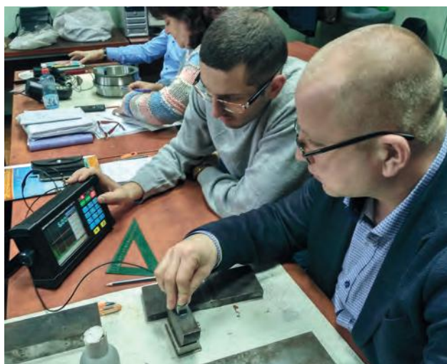
Навчання по UT