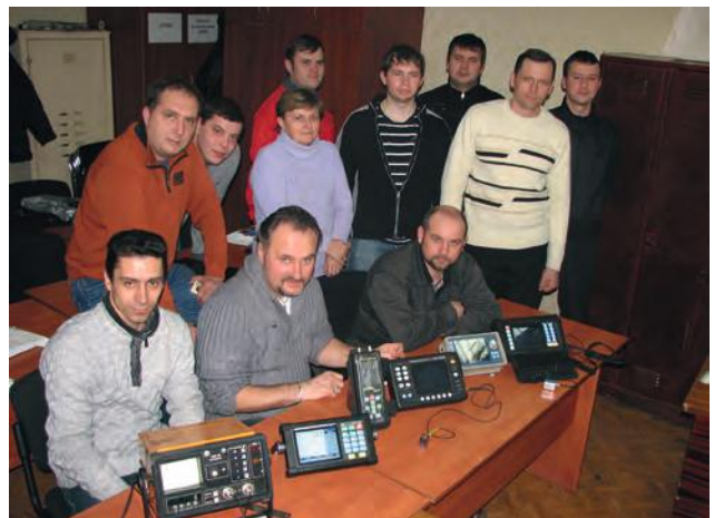
Група слухачів з НК