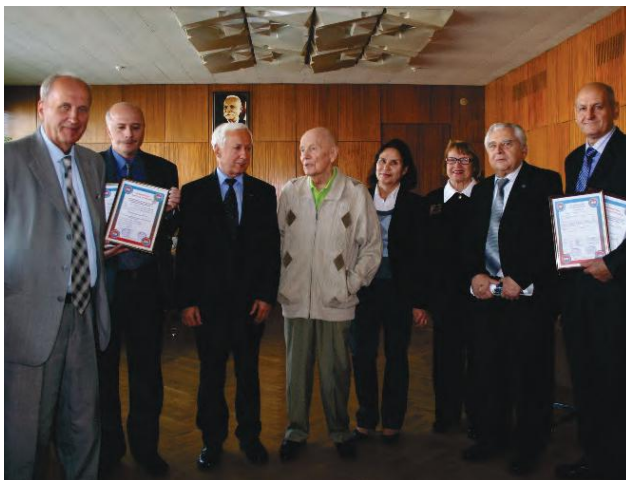
ПАТ «Краматорський завод важкого верстатобудування» та АТ «ТУРБОАТОМ»