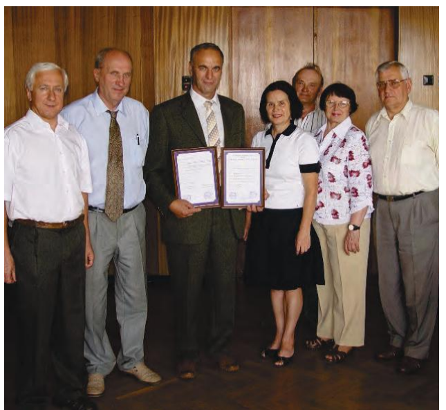
ПАТ «Крюківський вагонобудівний завод»