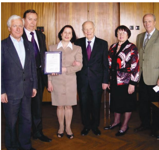
ПАТ «Запорізький завод важкого кранобудування»