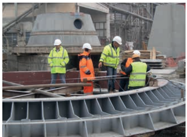
Проведення діагностики зварних з'єднань на Подільському цементному заводі

Іншим напрямком діяльності АЦНК є обстеження методами неруйнівного контролю технічного стану об'єктів підвищеної небезпеки з метою запобігання потенційно аварійним ситуаціям. Центр проводить неруйнівний контроль, технічне діагностування та технічне опосвідчення наступного обладнання: