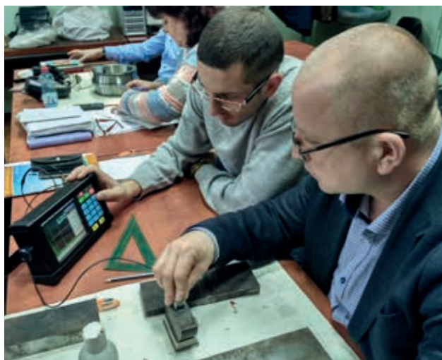
Навчання по UT