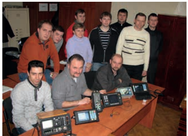
Група слухачів з НК