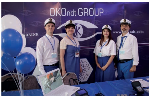
Представники Асоціації «ОКО»

повіді «Перша вітчизняна система швидкісного контролю залізничної колії OKOSCAN 73HS» мова йшла про розробку і впровадження на залізниці Туреччини (TCDD) швидкісної системи неруйнівного контролю (ультразвуковий і вихрострумний) рейок OKOSCAN 73HS, яка розроблена відповідно до вимог європейських стандартів і забезпечує контроль рейок на швидкості до 40 км/год (з можливістю збільшення швидкості контролю до 60 км/год).