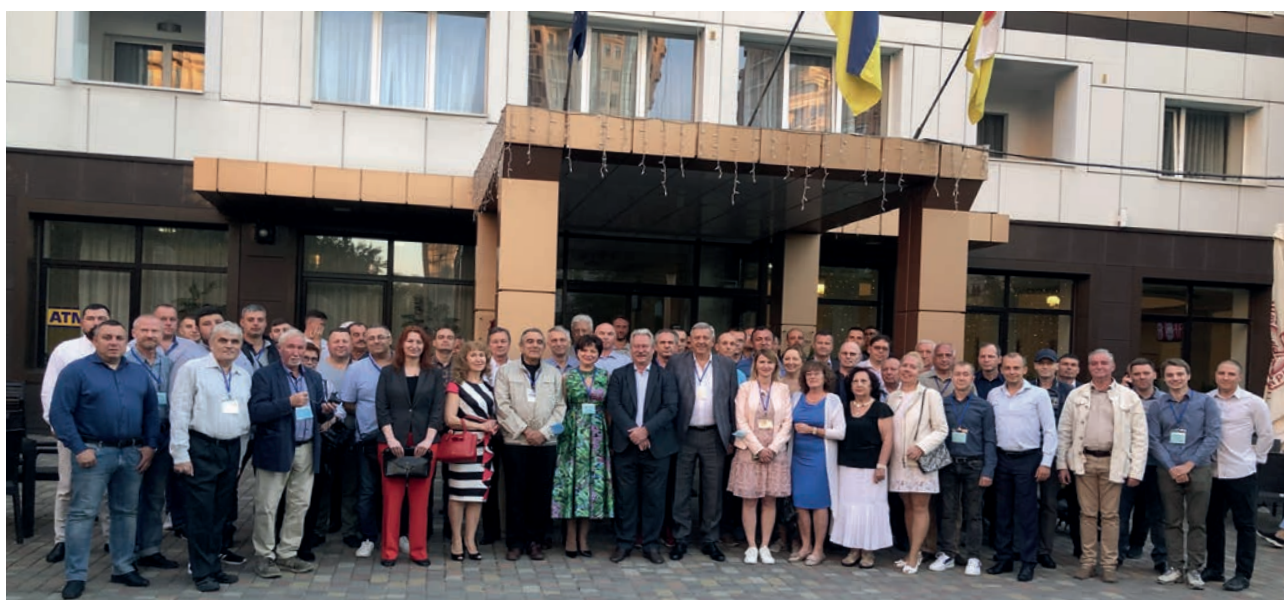
Учасники конференцій НКМТС-2021 та LTWMP-2021