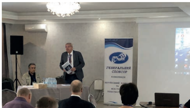
Виступ академіка І.В. Кривцуна при відкритті конференції

Конференцію відкрив вітальним словом академік НАН України, директор ІЕЗ ім. Є.О. Патона акад. Кривцун І.В. Він відзначив значну роль неруйнівного контролю та моніторингу технічного стану в промисловості, будівництві та на транспорті в сучасній Україні.