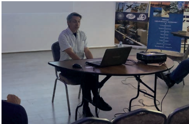
Доповідь О.В. Махненко

пошкодження в зоні з'єднання стінки з полкою. Результати чисельного визначення НДС прогонової балки показали, що наявність локальних корозійних дефектів в різних характерних зонах балки в зоні з'єднання стінки з полкою не викликає суттєвого підвищення повздовжніх напружень в цих зонах та зварна конструкція головних прогонових балок мосту ім. Є.О. Патона має досить значний коефіцієнт запасу статичної міцності стосовно нормативного розподіленого навантаження. Було представлено дві доповіді, які торкались давньої проблеми атомних станцій – «Нові аспекти пошкоджуваності металу вузла зварного з'єднання колектора з патрубком Ду1200 парогенератора ПГВ-1000», «Визначення залишкових напружень в вузлі приварювання колектору до патрубка Ду1200 парогенераторів ПГВ-1000 після локальної термічної обробки».