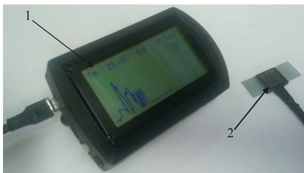
Рис.1. Електронний реєстратор з обробкою сигналів термоелектричного сенсора теплового потоку: 1 - електронний реєстратор, 2 – термоелектричний сенсор

Блок-схема приладу (рис.2) складається з таких функціональних вузлів: термоелектричний сенсор із вбудованою термопарою для вимірювання теплового потоку і температури тіла людини, підсилювач сигналу термопари з компенсатором температури навколишнього середовища, аналогово-цифрові перетворювачі (АЦП) для перетворення аналогових сигналів сенсора у цифрові, блок обробки цифрових сигналів для збереження і графічного відображення даних на дисплеї.