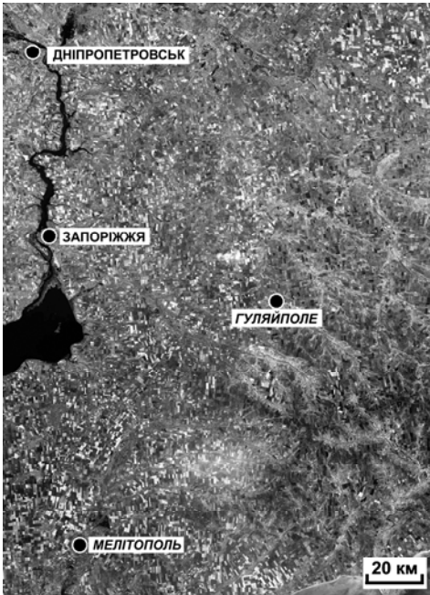
Рис. 1. Район Оріхово-Павлоградської шовної зони і прилеглих територій Українського щита. Фрагмент комп'ютерно обробленої мозаїки сканерних багатозональних космічних знімків LANDSAT ETM+, отриманих улітку 2000 р. (7-й, середній інфрачервоний-2, канал, 2,09–2,35 мкм). Розпізнаються гідрографічна мережа і заболочені ділянки, що доповнюють і підкреслюють одна одну (LANDSAT–LAND Remote Sensing SATellite, серія супутників для дистанційного дослідження природних ресурсів Землі, США; ETM+ – Enhanced Thematic Mapper plus, удосконалений тематичний картограф <пристрій для отримання іконічних даних дистанційного зондування>)

сферного електричного потенціалу над розломами) до стратосфери 3 (орографічний ефект, формування і розпад хмарових утворень над зонами великих розривних порушень) й іоносфери (береговий ефект у сіяннях, радіо-аврора над глибокими розломами, орографічні ефекти в іоносфері) [57].