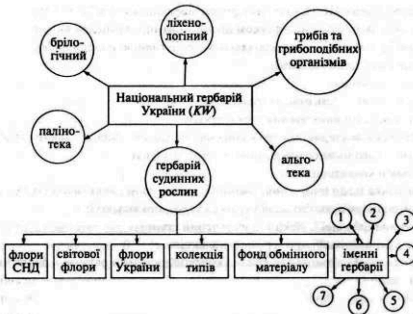
Рис. 1. Структура Національного гербарію України (КН): 1 — Ж.Е. Жілібера; 2 — В.Г. Бес-сера; 3 — О.С. Роговича; 4 — І.Ф. Шмальгаузен; 5 — М.С. Турчанинова; 6 — М.В. Клокова; 7 — В.М. Черняєва