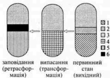
Рис. 1. Схема демутації рослинних угруповань та екотонів на пробних площах: 1 — Caricetum rostratae eriophorosum ; 2 — природний екотон; 3 — Piceetum myrtillosum ; 4 — Rumicetum daschampsiosum ; 5 — Deschampsietum calamagrostiosum ; 6 — похідний екотон