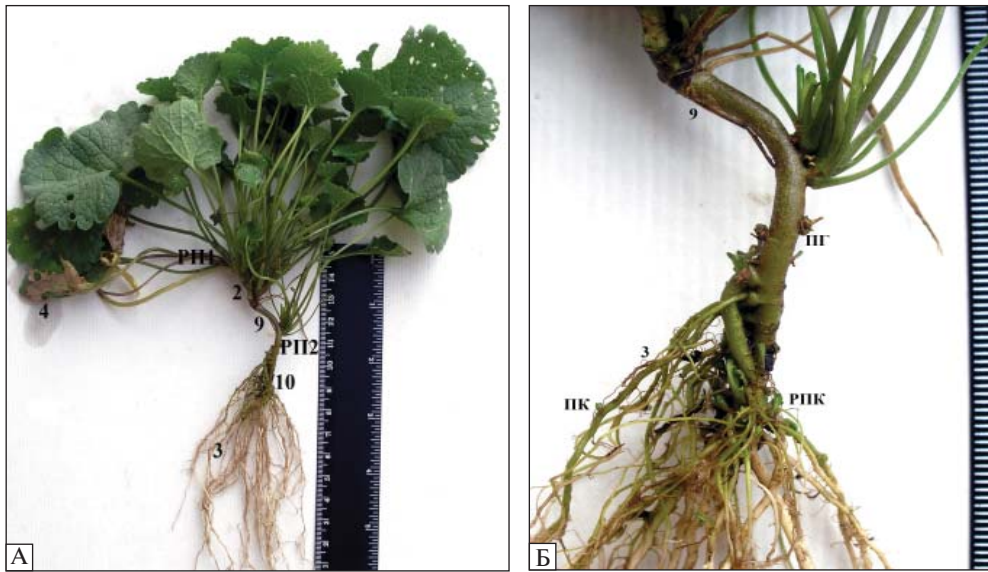
Рис. 1. Растение Sobolewskia sibirica в первый год жизненного цикла. A — общий вид; B — hypocotyl и корневая система: РП1 — розеточный побег конодия, РП2 — розеточный побег hypocotyla, РПК — розеточный побег корня, ПГ — hypocotylная почка, ПК — корневая почка. Здесь и на рис. 2: 1 — генеративный побег, 2 — конодий, фрагмент конодия, 3 — корневая система, 4 — лист, 5 — аксиллярная почка, 6 — паракладий, 7 — крошечный лист, брактя, 8 — частичное соцветие, 9 — hypocotyl, 10 — адвентивная почка