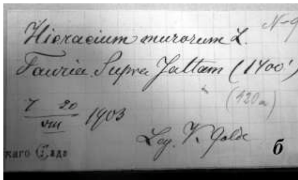
Рис. 2. Ізоотип H. laevimarginatum : а — загальний вигляд гербарного аркуша; б — гербарна етикетка