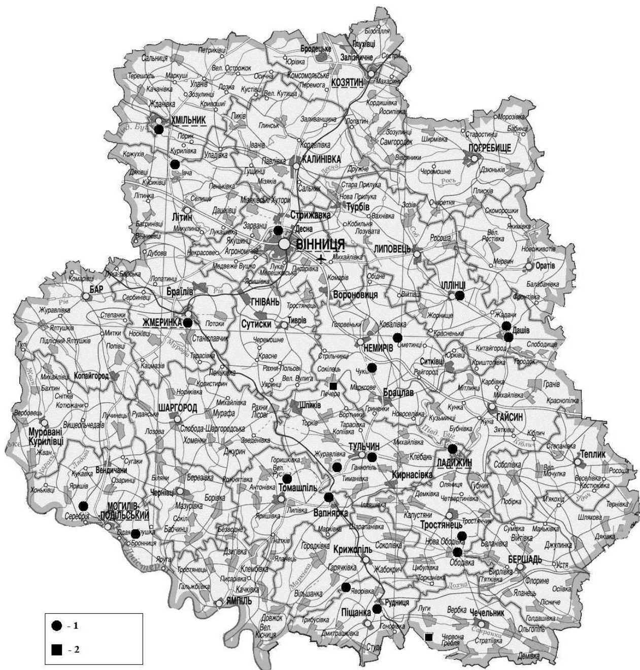
Рис. 1. Картохема поширення Scopolia carniolica у Вінницькій обл. У мовні позначення: 1 — відомі місцезнаходження; 2 — нові місцезнаходження