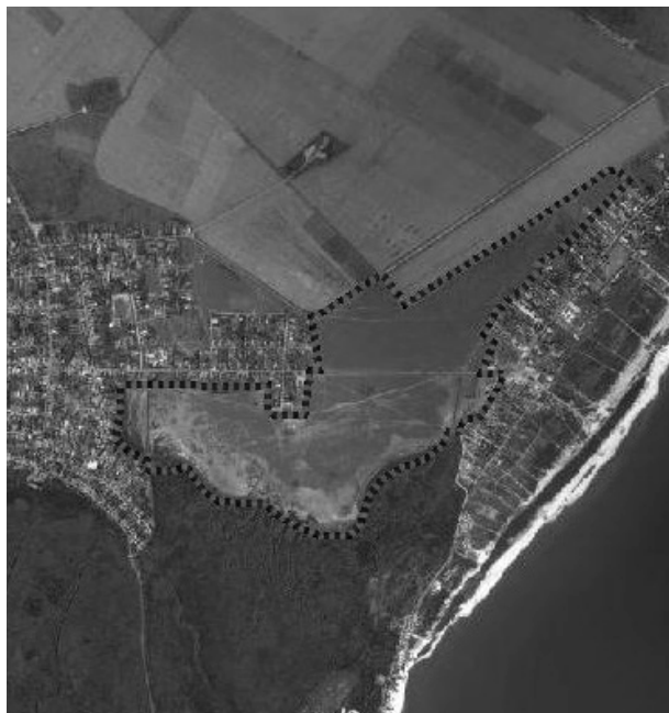
Рис 1. Контури меж території полігону «Приморський» на космічному знімку

Вихідними даними для їх обробки з метою створення моделі рослинності полігону були мультиспектральні супутникові зображення цієї території (рис 1.), отримані з різних сенсорів і придбані на умовах академічної ліцензії. До вибору архівних знімків висувалися такі критерії: відсутність значної кількості хмар та оптимальний час зйомки. Характеристику отриманих спектральних зображень наведено в таблиці.