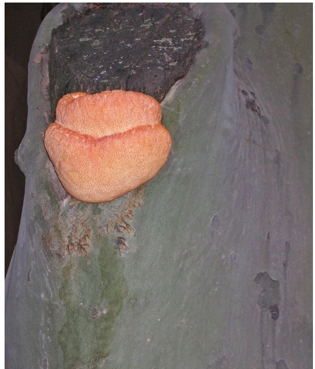
Рис. 2. Плодове тіло Hericium erinaceus на стовбурі Platanus × hispanica