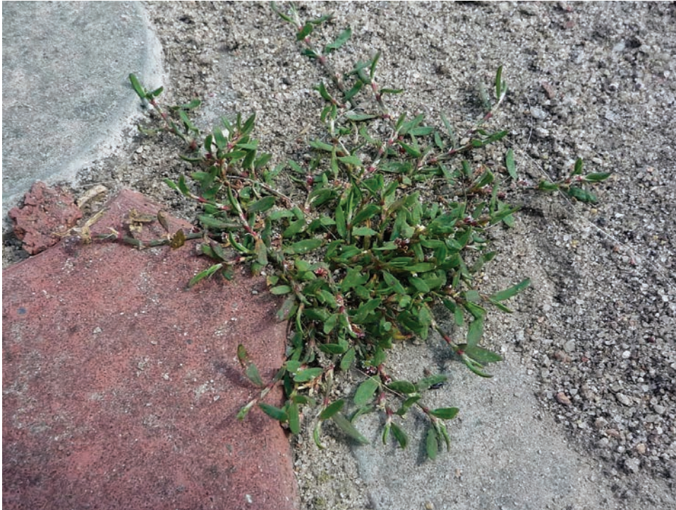
Рис. Е2. Polygonum calcatum на тротуарі у м. Бердичів Fig. E2. Polygonum calcatum on the sidewalk in Berdychiv