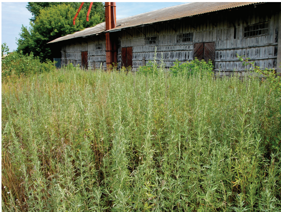
Рис. 1. Колонія Artemisia umbrosa на території залізничного вокзалу в м. Бердичів Fig. 1. Colony Artemisia umbrosa on the territory of the railway station in Berdychiv