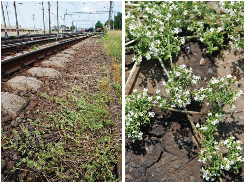
Рис. E13. Galium humifusum на залізничному полотні в м. Бердичів Fig. E13. Galium humifusum on the railway line in Berdychiv