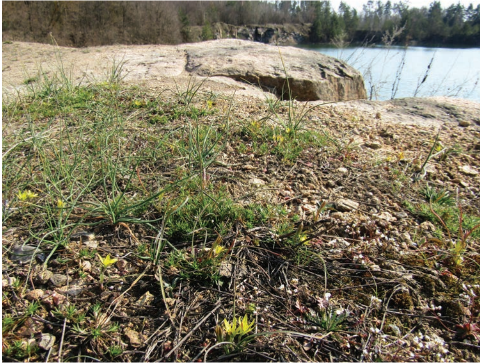
Рис. E12. Місцезростання Gagea bohemica на гранітному відслоненні біля Верхівня Село Ружинського району Fig. E12. Gagea bohemica habitat on granite outcrop near Verkhivnya Village, Ruzhyn District