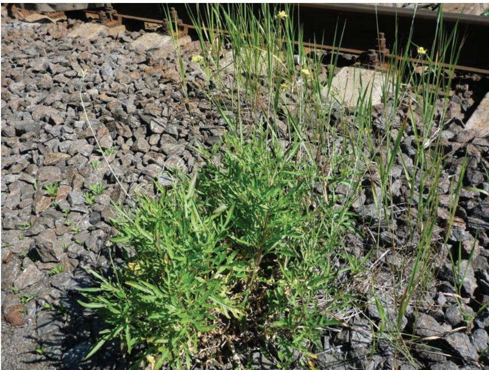
Рис. Е9. Diplotaxis tenuifolia на залізниці у м. Бердичів