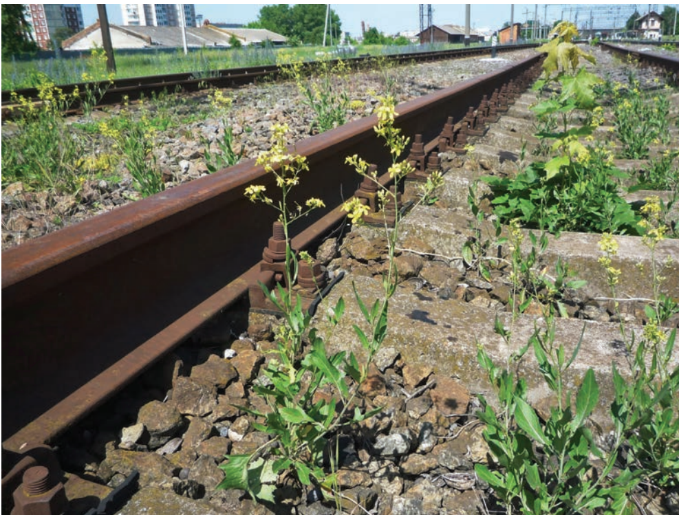
Рис. Е17. Колонія Sisymbrium volgense на залізниці в м. Бердичів