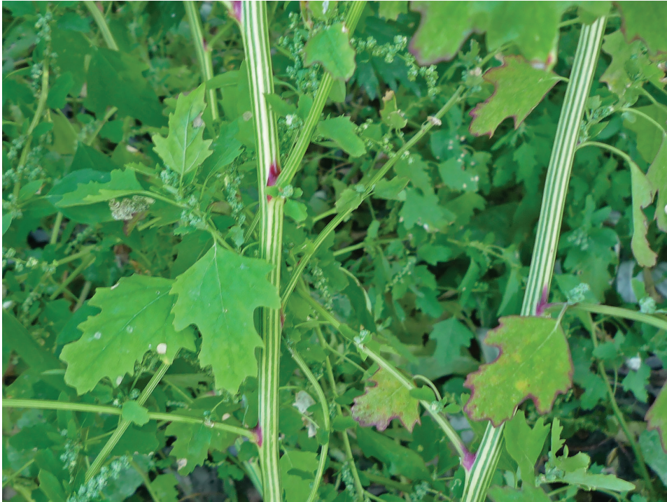
Рис. 3. Chenopodium ucrainicum у смт Ружин Fig. 3. Chenopodium ucrainicum in the Ruzhyn Town