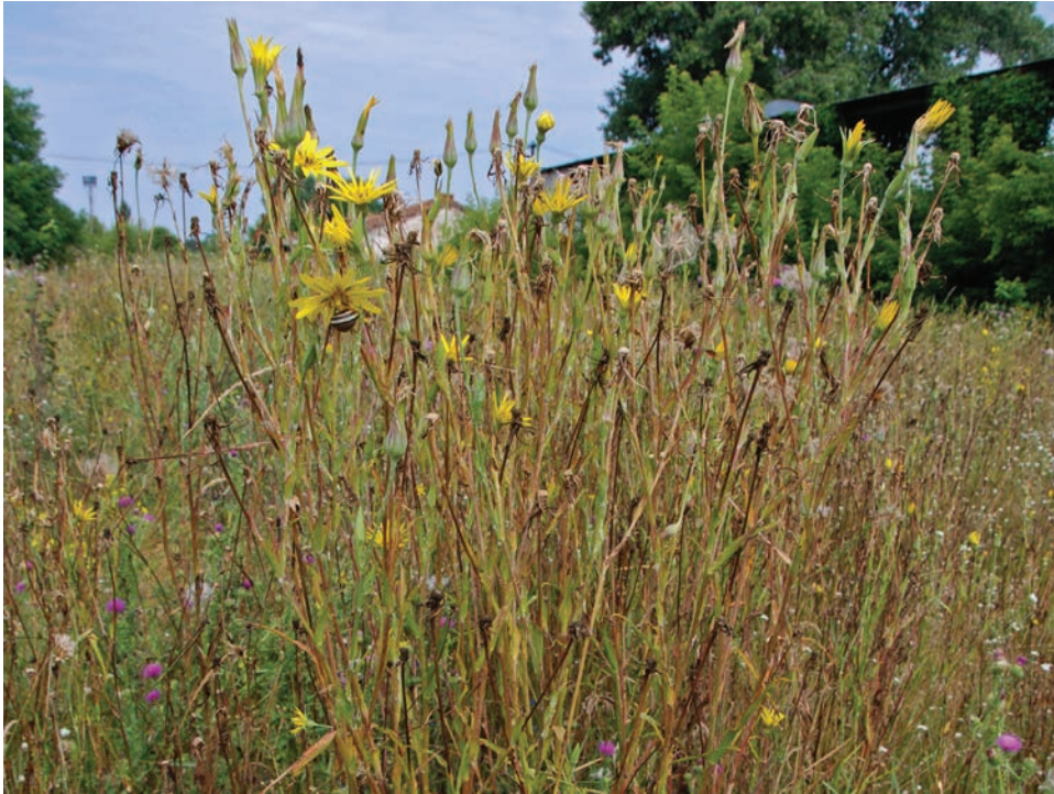
Рис. E20. Tragopogon podolicus у м. Бердичів Fig. E20. Tragopogon podolicus in Berdychiv