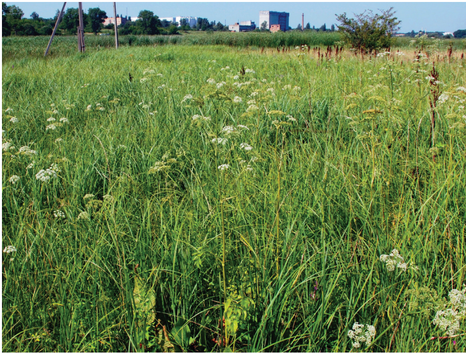
Рис. 6. Ostericum palustre на болоті в околицях м. Бердичів Fig. 6. Ostericum palustre in the swamp near Berdychiv