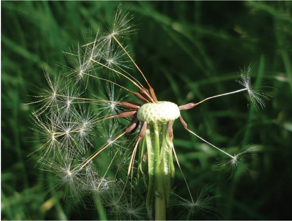
Рис. E18. Taraxacum proximum в бору біля Бердичіва Fig. E18. Taraxacum proximum in a pine forest near Berdychiv