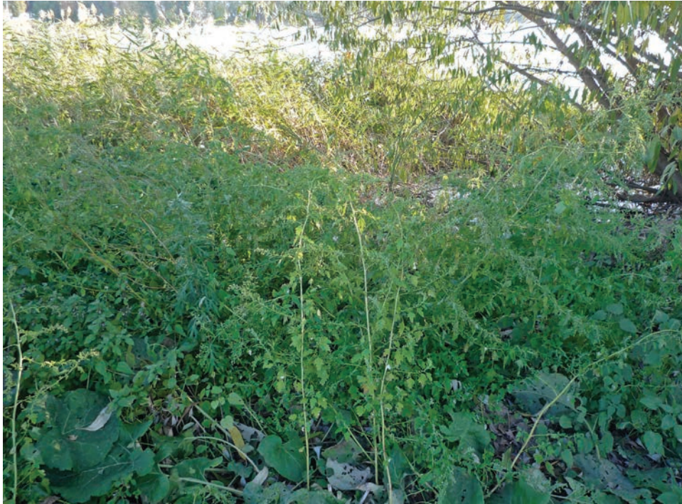
Рис. Е6. Місцезростання Chenopodium ucrainicum на березі ставу у м. Ружин Fig. E6. Habitat of Chenopodium ucrainicum on the shores of the pond in Ruzhyn Town