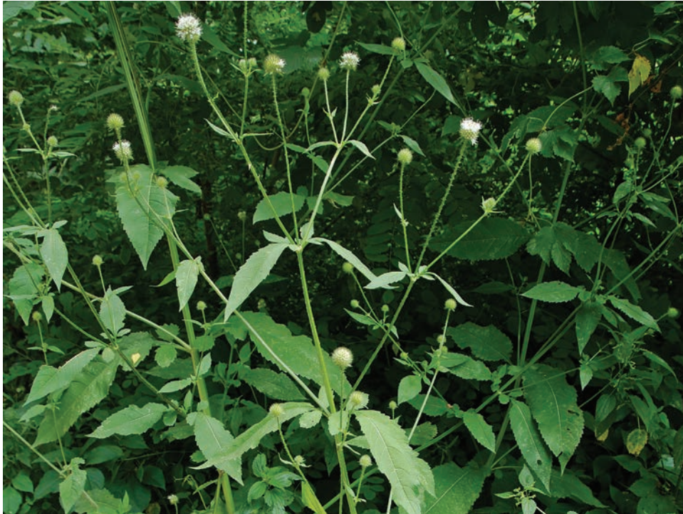
Рис. E10. Dipsacus pilosus в 109 кварталі Андрушівського лісництва, Бердичівський район Fig. E10. Dipsacus pilosus in the 109th quarter of Andrushivka forestry, Berdychiv District