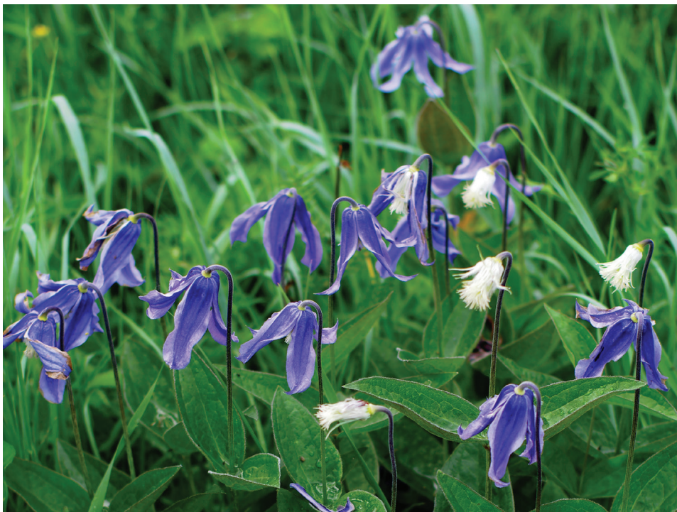
Рис. 4. Clematis integrifolia на лучному степу у м. Бердичів Fig. 4. Clematis integrifolia on the meadow steppe in Berdychiv