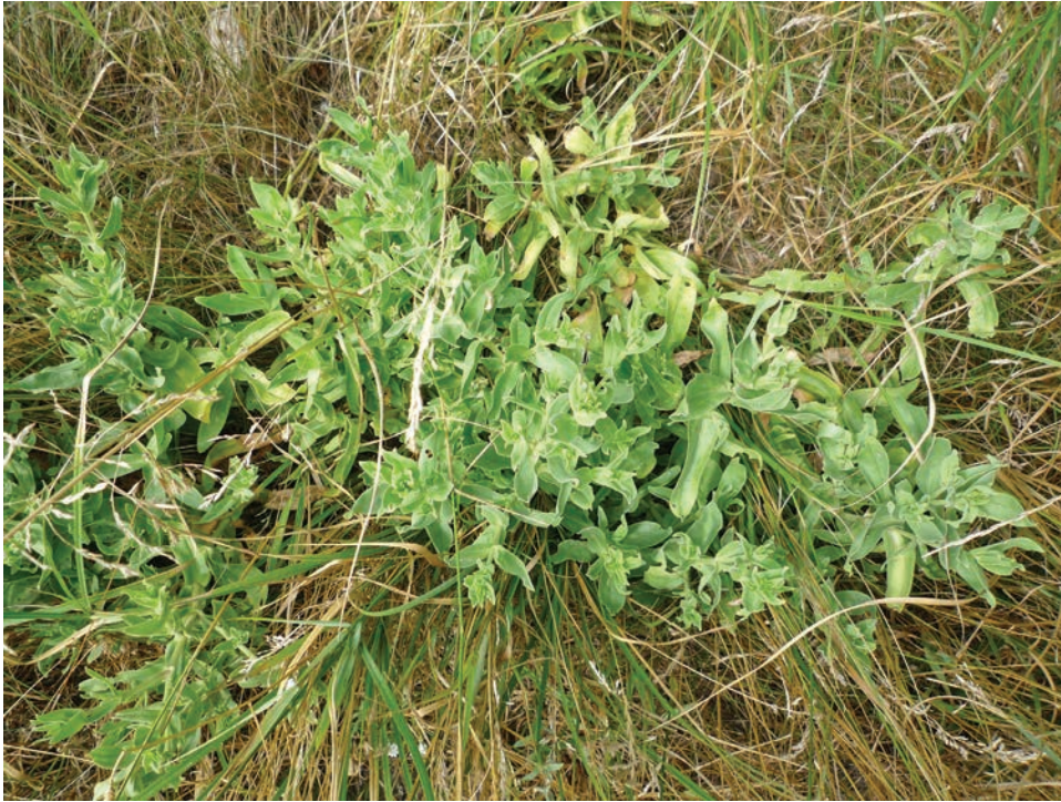
Рис. E14. Gypsophila perfoliata біля залізничних складів у м. Бердичів Fig. E14. Gypsophila perfoliata near the railway depots in Berdychiv