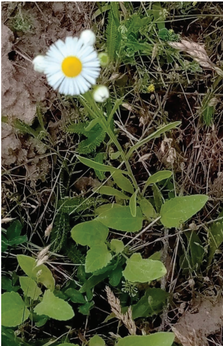
Рис. E1. Erigeron strigosus біля м. Бердичів Fig. E1. Erigeron strigosus near Berdychiv