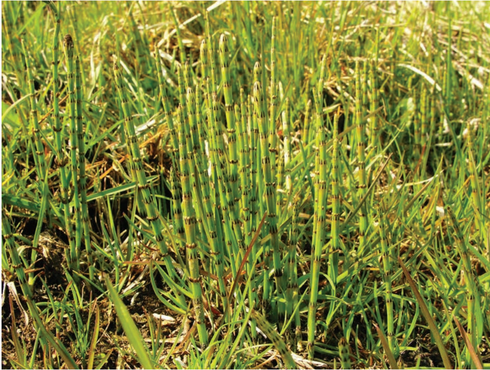
Рис. E22. Equisetum variegatum в околицях с. Сінгури Житомирського району Fig. E22. Equisetum variegatum near Singury Village, Zhytomyr District