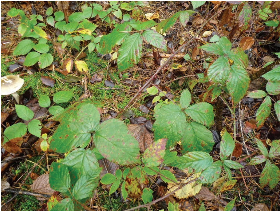
Рис. E23. Rubus bertramii та R. hirtus aggr. в сосновому лісі біля с. Пряжів Житомирського району Fig. E23. Rubus bertramii and R. hirtus aggr. in a pine forest near the Pryazhiv Village, Zhytomyr District