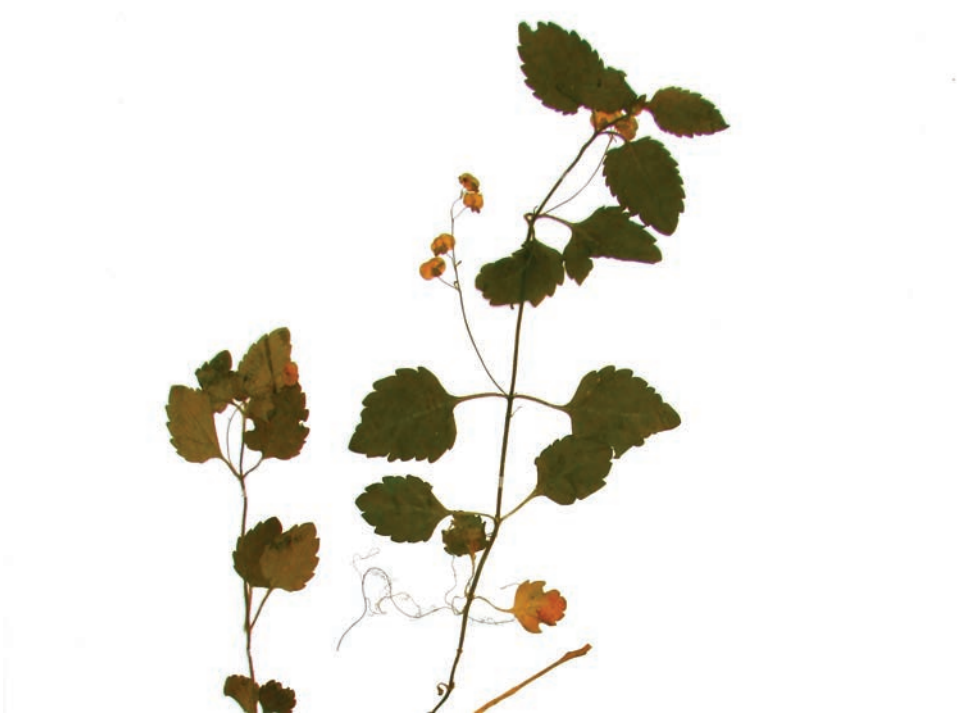
Рис. E21. Гербарний зразок Veronica montana , зібраний у 36 кварталі Гвоздяренського лісництва, Житомирський район Fig. E21. Herbarium specimen of Veronica montana from the 36 th quarter of Gvozdyaren forestry, Zhytomyr District