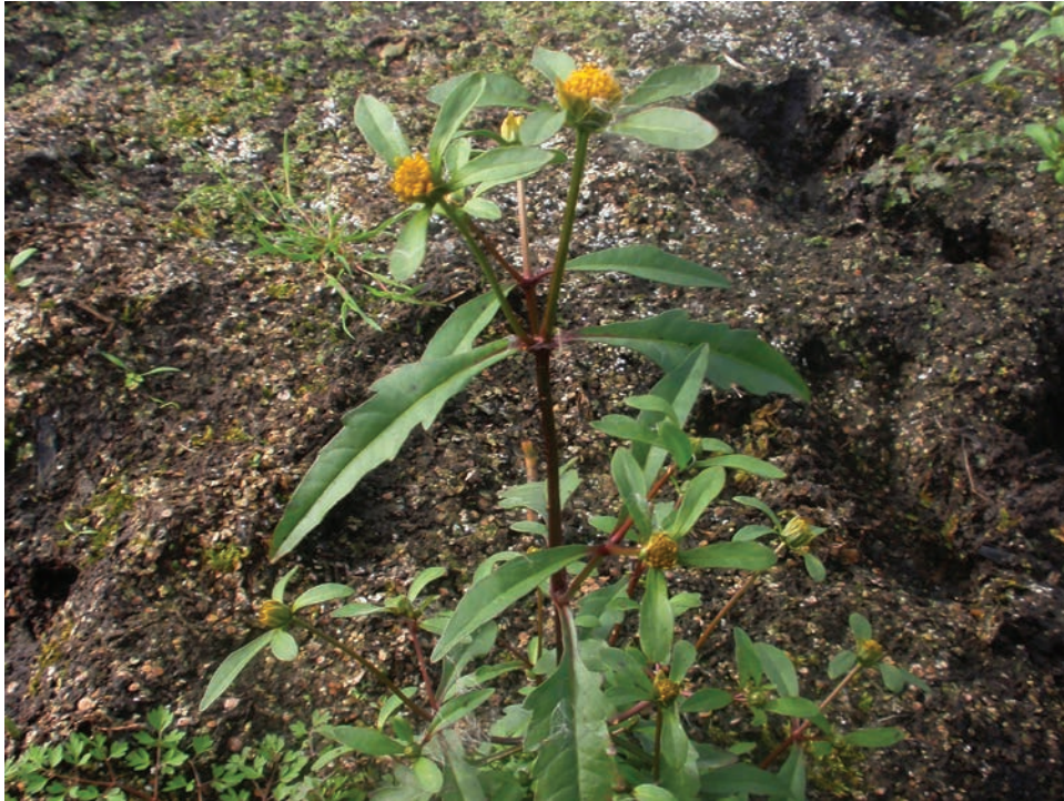
Рис. Е4. Bidens connata на березі р. Случ біля смт Миропіль Fig. E4. Bidens connata on the banks of the river Sluch near Myropil Town