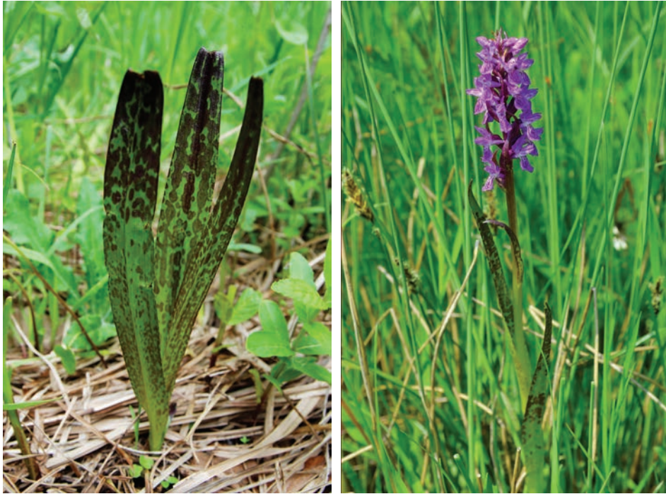
Рис. Е8. Dactylorhiza incarnata subsp. cruenta . А: на березі р. Случ біля смт Миропіль; В: на лузі біля с. Певна Бердичівського району