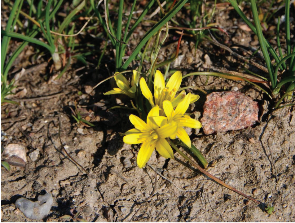
Рис. 5. Gagea bohemica біля с. Верхівня Ружинського району Fig. 5. Gagea bohemica near Verkhivnya Village, Ruzhyn District