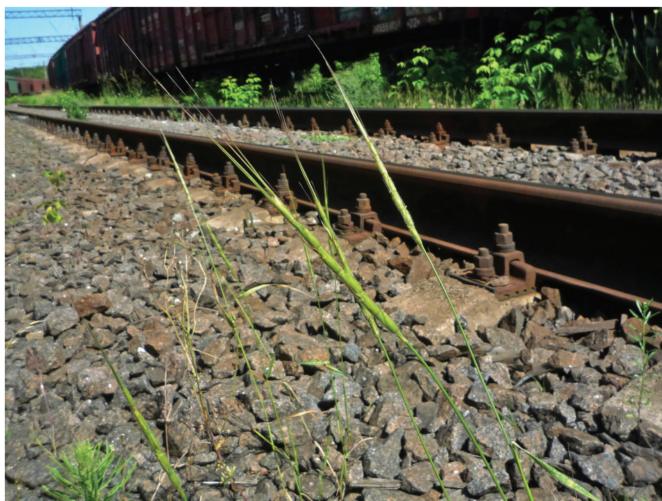
Рис. 2. Aegilops cylindrica на залізниці в м. Бердичів Fig. 2. Aegilops cylindrica on the railway in Berdychiv