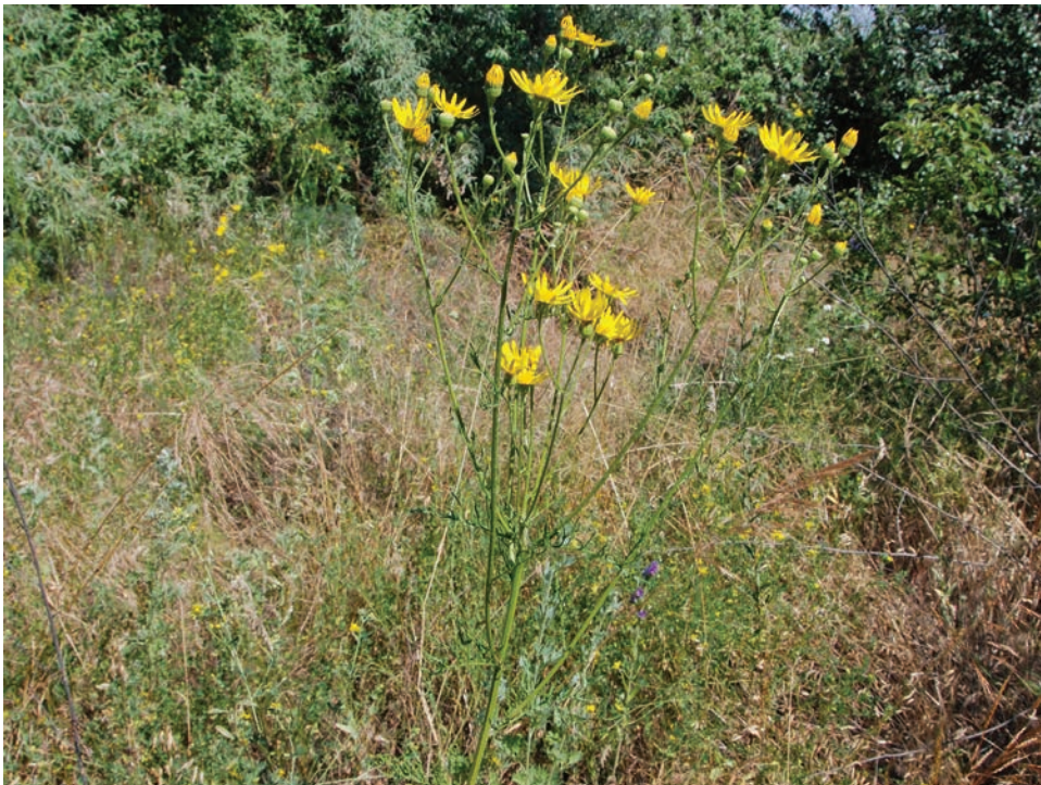
Рис. E15. Jacobaea erucifolia біля с. Топори Ружинського району Fig. E15. Jacobaea erucifolia near Topory Village, Ruzhyn District