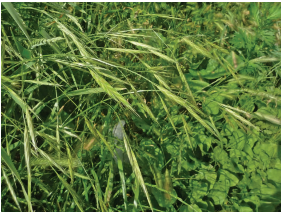
Рис. Е5. Bromus carinatus у м. Бердичів Fig. E5. Bromus carinatus in Berdychiv