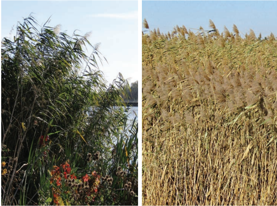
Рис. Е16. Phragmites altissimus на березі р. Гнилоп'ять у Бердичіві (А); зарості P. altissimus височіють над смугою P. australis , околиці м. Бердичів (В)