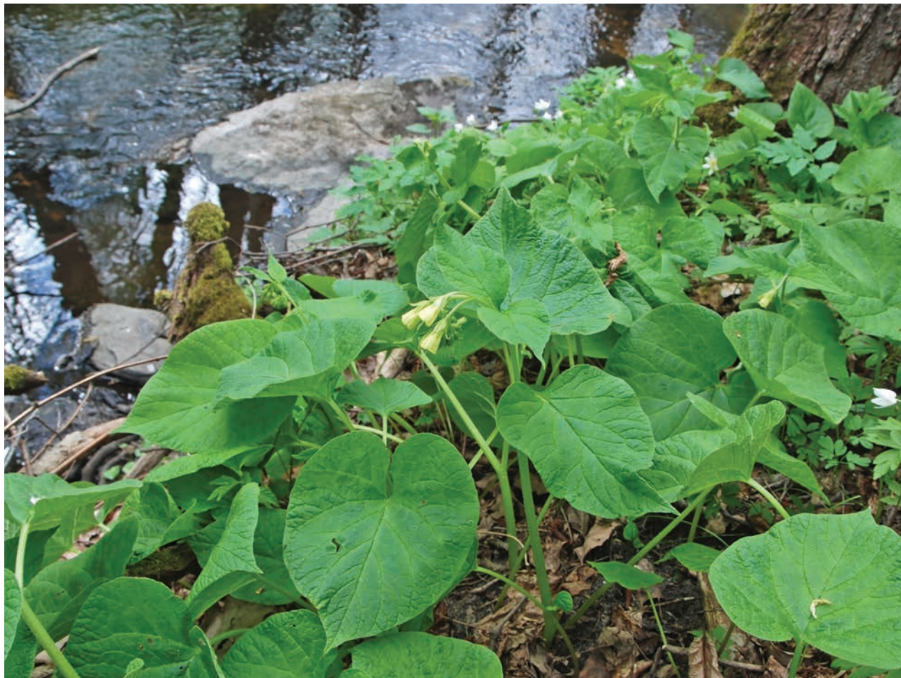
Рис. E24. Symphytum cordatum на березі струмка – притоки р. Случ, біля смт Миропіль