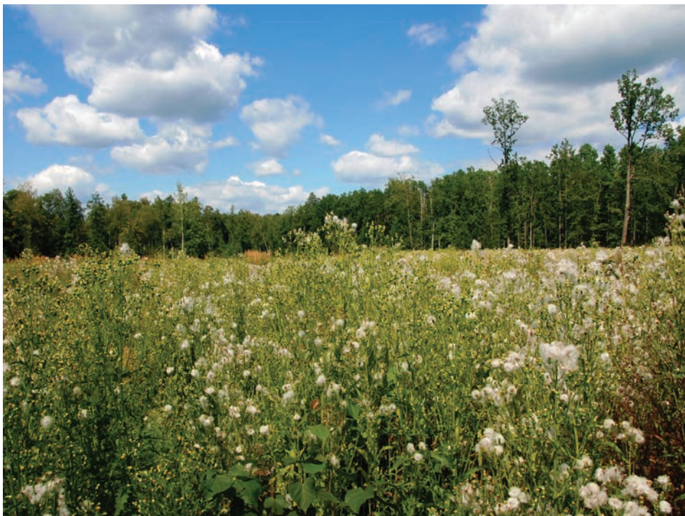
Рис. E11. Зарості Erechtites hieracifolia у 33 кварталі Пилипівського лісництва, Житомирський район Fig. E11. Erechtites hieracifolia thickets in the 33rd quarter of Pylypivsky forestry, Zhytomyr District