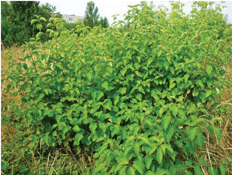
Рис. Е7. Cornus sanguinea subsp. australis обабіч залізниці у м. Бердичів Fig. E7. Cornus sanguinea subsp. australis near the railway in Berdychiv