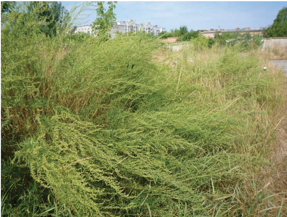
Рис. Е3. Artemisia dracunculus біля залізничних складів у м. Бердичів Fig. E3. Artemisia dracunculus near the railway depots in Berdychiv