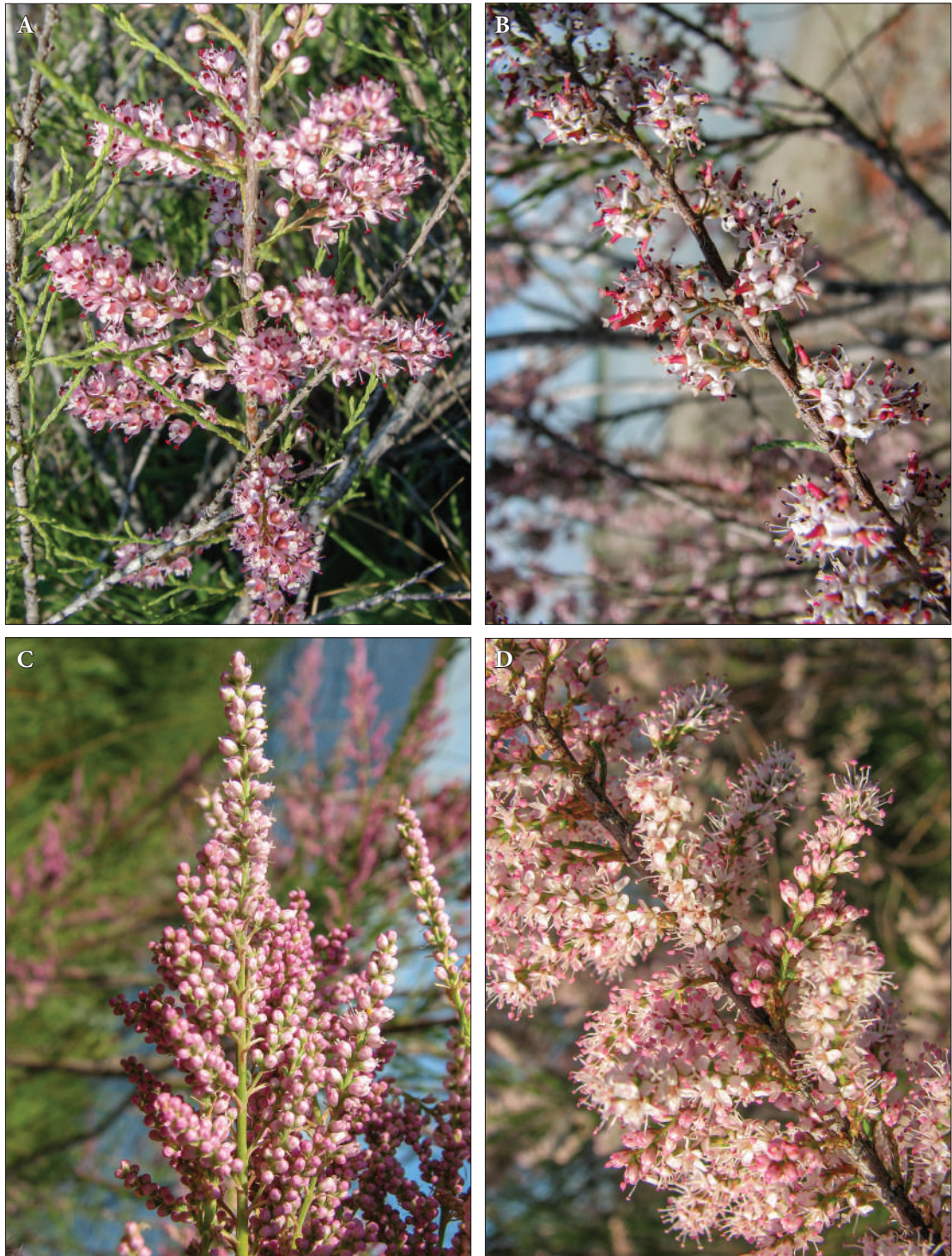
Рис. 3. Суцвіття видів роду Tamarix з Білосарайської коси. А: T. gracilis . 08.05.2016; В: T. laxa . 08.05.2016; С: T. ramosissima . 07.06.2015; D: T. tetrandra . 13.05.2016