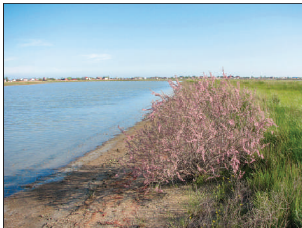
Рис. 2. Tamarix laxa на Білосарайській косі. 08.05.2016