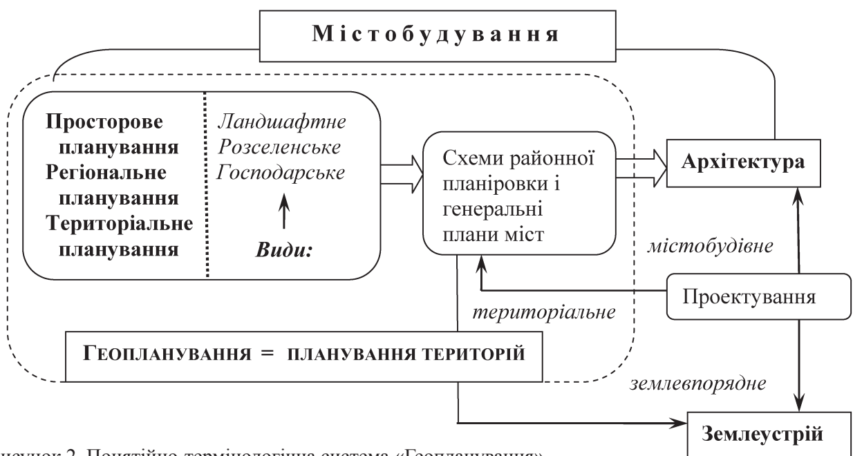
Рисунок 2. Понятійно-термінологічна система «Геопланування»