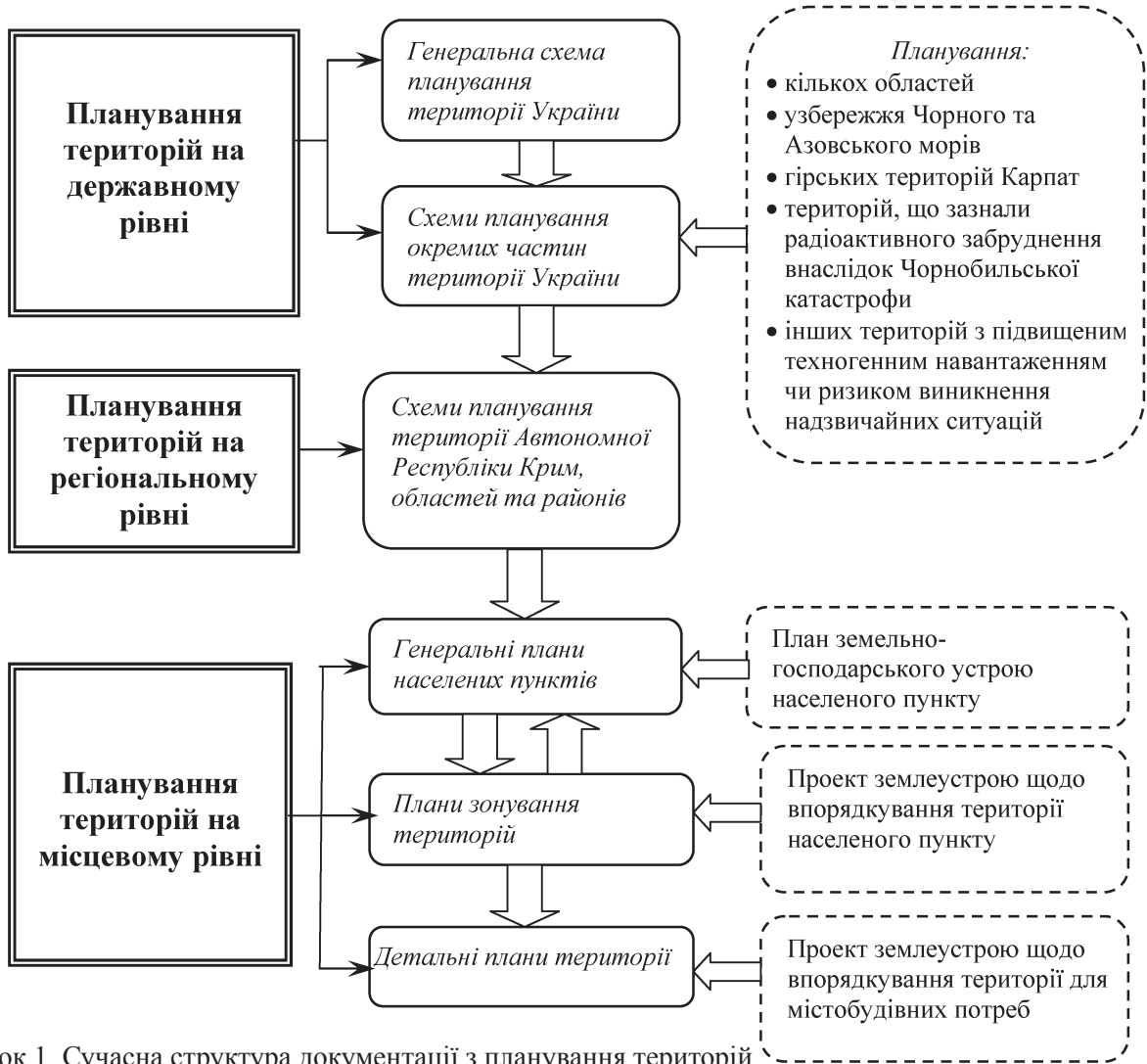
Рисунок 1. Сучасна структура документації з планування територій