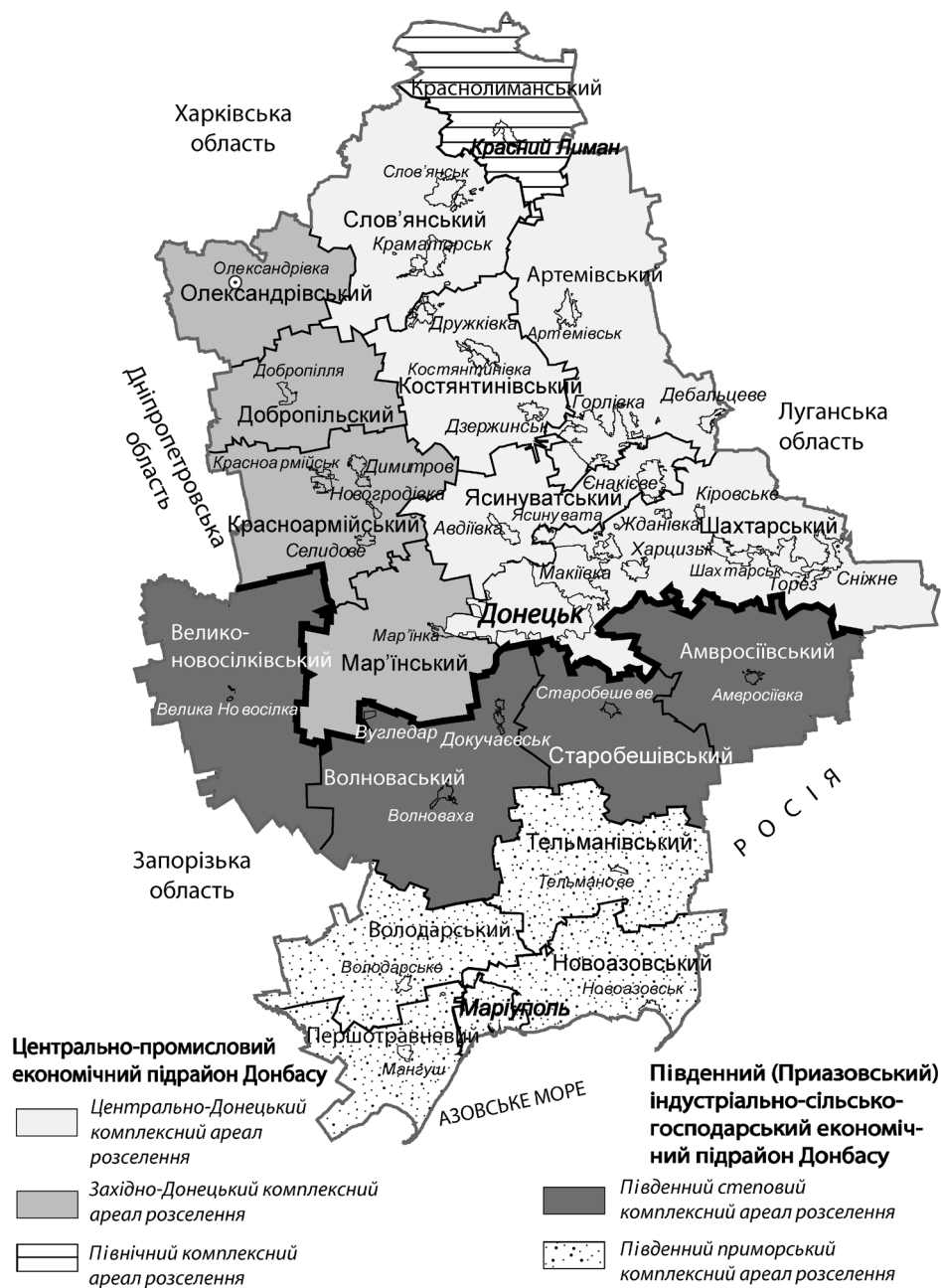
Рисунок 2. Система комплексних ареалів розселення на території Донецької області Складено з використанням [3, с.93-96; 4, с. 90-91]

рію зосередження великих міст, провідних промислових підприємств та основні райони вугледобування. Він включає три ареали розселення.