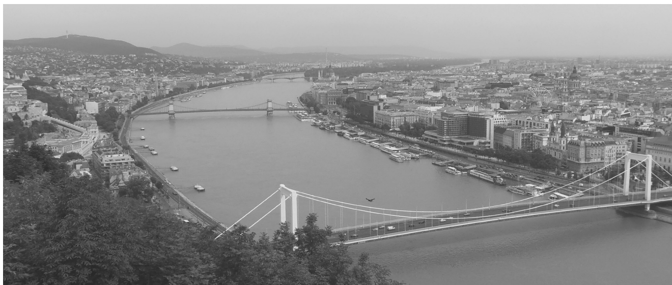
Рисунок 2. Вид на размещённые в Будапеште по обоим берегам Дуная объекты «Всемирного наследия» ЮНЕСКО