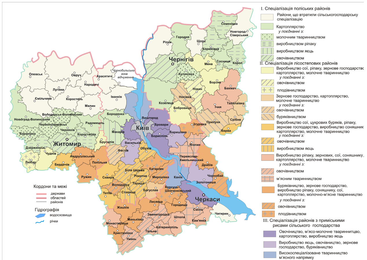
Рисунок 2. Спеціалізація сільського господарства Київського Придніпров'я, 2012 р.