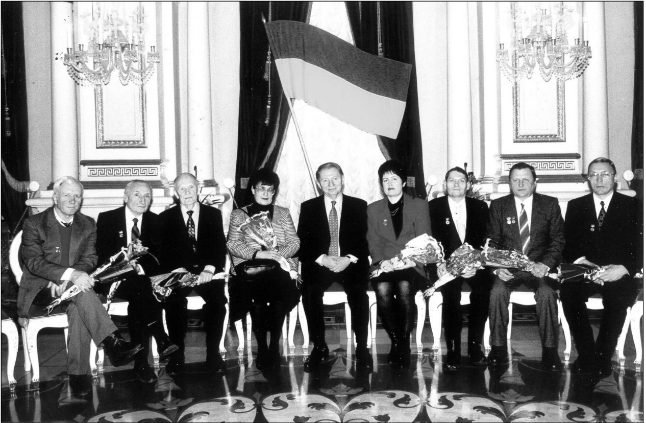
Вручення Державної премії України, 1995 р. Зліва направо: П.М. Томчук, М.К. Шейкман, Б.Є. Патон, Н.Б. Лук'янчинова, Л.Д. Кучма, Т.В. Торчинська та ін.

ру Інституту фізики, а вже той передав батькові на неофіційну рецензію. Існує певний тип науковців, які полюбляють переписати якесь відоме явище у своїх особливих термінах і позначеннях. Ця книга була прикладом екстремального прояву таких явищ.