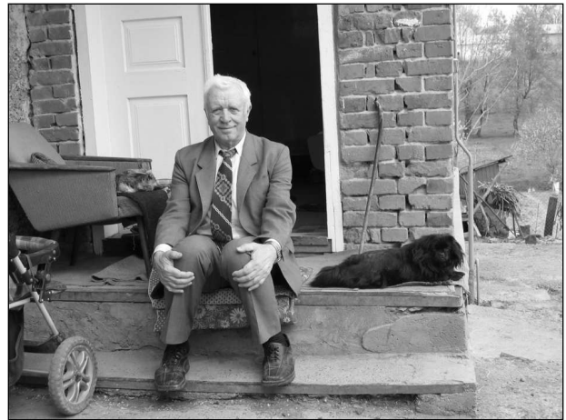
У селі на Тернопільщині, 2008 р.

З роками у відділі й загалом в інституті склались певні традиції – спільно відзначали дні народження і свята у відділі чи в бібліотеці. Мені завжди імпонувало відчуття людяних відносин і