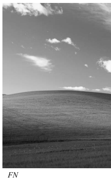
Рис. 2. Изображение поверхности, заданной матрицей–оригиналом FN

Размерность матриц V11_{100 \times 600} , V12_{100 \times 600} , F11_{200 \times 400} , F12_{200 \times 400} не позволяет в данной публикации привести эти матрицы.