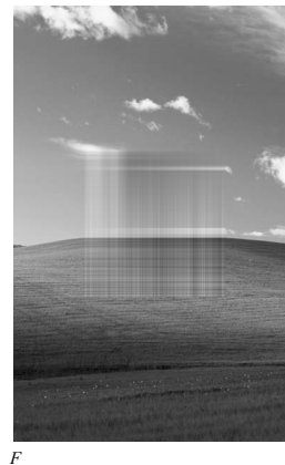
Рис. 4. Изображение воссозданной поверхности по данным изображениям на четырех полосах.

демонстрирует достаточную для практики точность без использования производных в эрмитовой интерполяции. Анализ результатов вычисляемого эксперимента подтверждает, что точность возобновления поверхности между полосами будет улучшаться, если расстояние между ними будет уменьшаться.