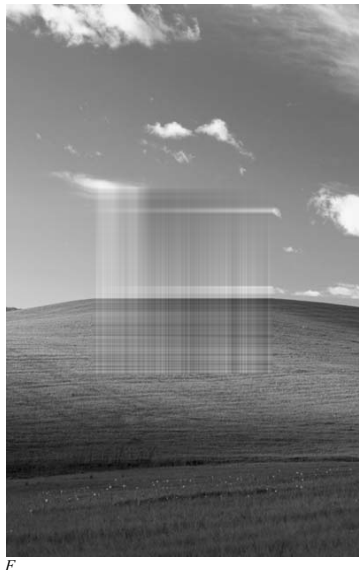
Рис. 4. Зображення відтвореної поверхні за даними зображеннями на чотирьох смугах

вимірного тіла на основі даних про поверхню заданих лише на системі горизонтальних та вертикальних смуг. Досліджено похибку, яка виникає при наближенні поверхні формулами інтерлінації в кожній прямокутній області, розміщеній між двома горизонтальними та двома вертикальними сусідніми смугами. Оцінки похиб-