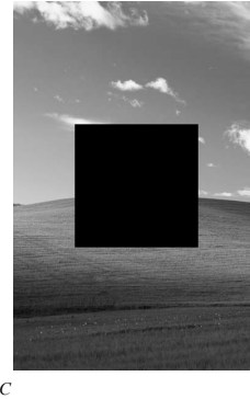
Рис. 3. Изображение поверхности на четырех заданных полосах одновременно.

ной области, размещенной между двумя горизонтальными и двумя вертикальными соседними полосами. Оценки погрешности получены в предположении, что для описания исследуемой поверхности z = f(x, y) используется функция f(x, y) с непрерывными частными производными порядков 2(N+1) по x и 2(N+1) по y . Случай, когда функция f(x, y) недифференцируемая, должен исследоваться с помощью модулей непрерывности, а не частных производных. Приведенный пример