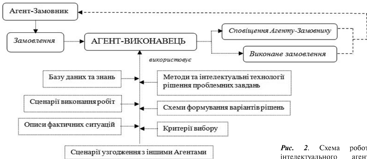
Рис. 2. Схема роботи інтелектуального агента розумного цеху

потребує розумного колективу (освіченого, навченого персоналу, що володіє сучасними промисловими, організаційними й інформаційними технологіями та прогресивними методами розв'язання проблемних задач [24, 25]. Формування такого колективу потребує великих коштів і часу.