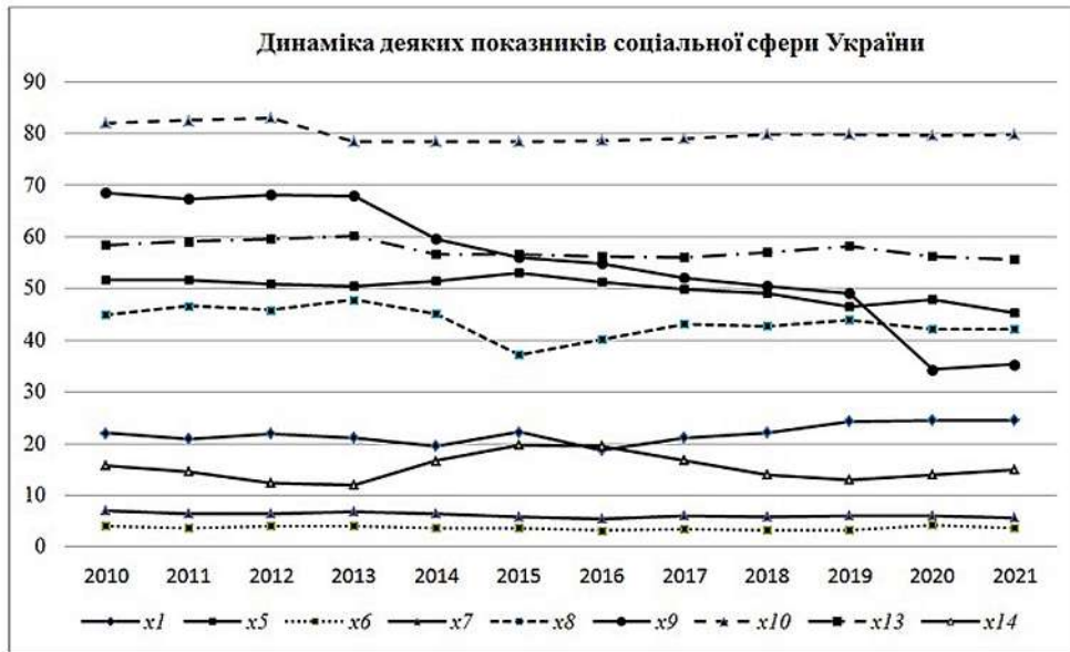
Рис. 3. Динаміка деяких показників соціальної сфери України, 2010–2020 рр.