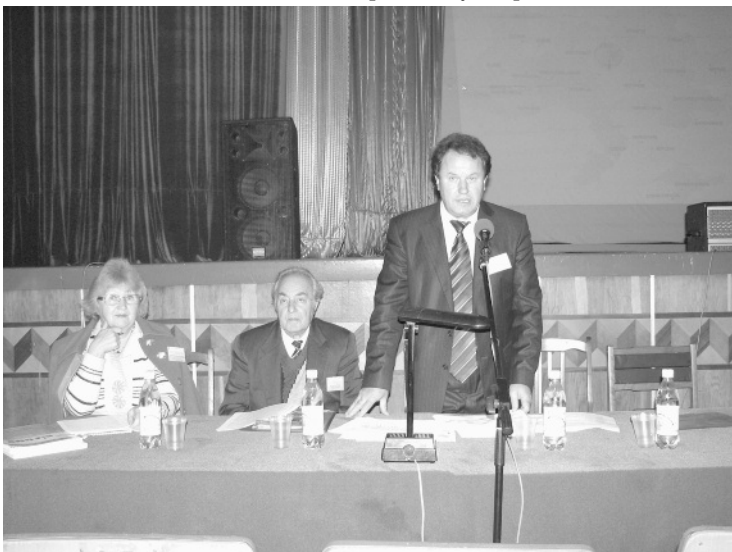
Під час конференції