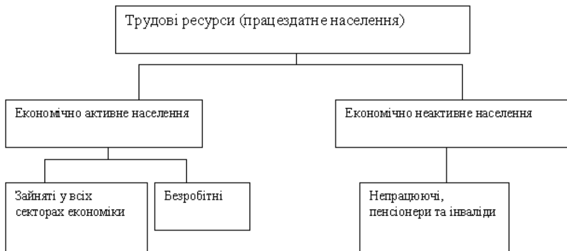
Схема 1. Структура трудових ресурсів

праці»; «Трудові ресурси: аспекти формування та розвитку» 2 ; «Трудовий потенціал України: формування та використання» 3 .