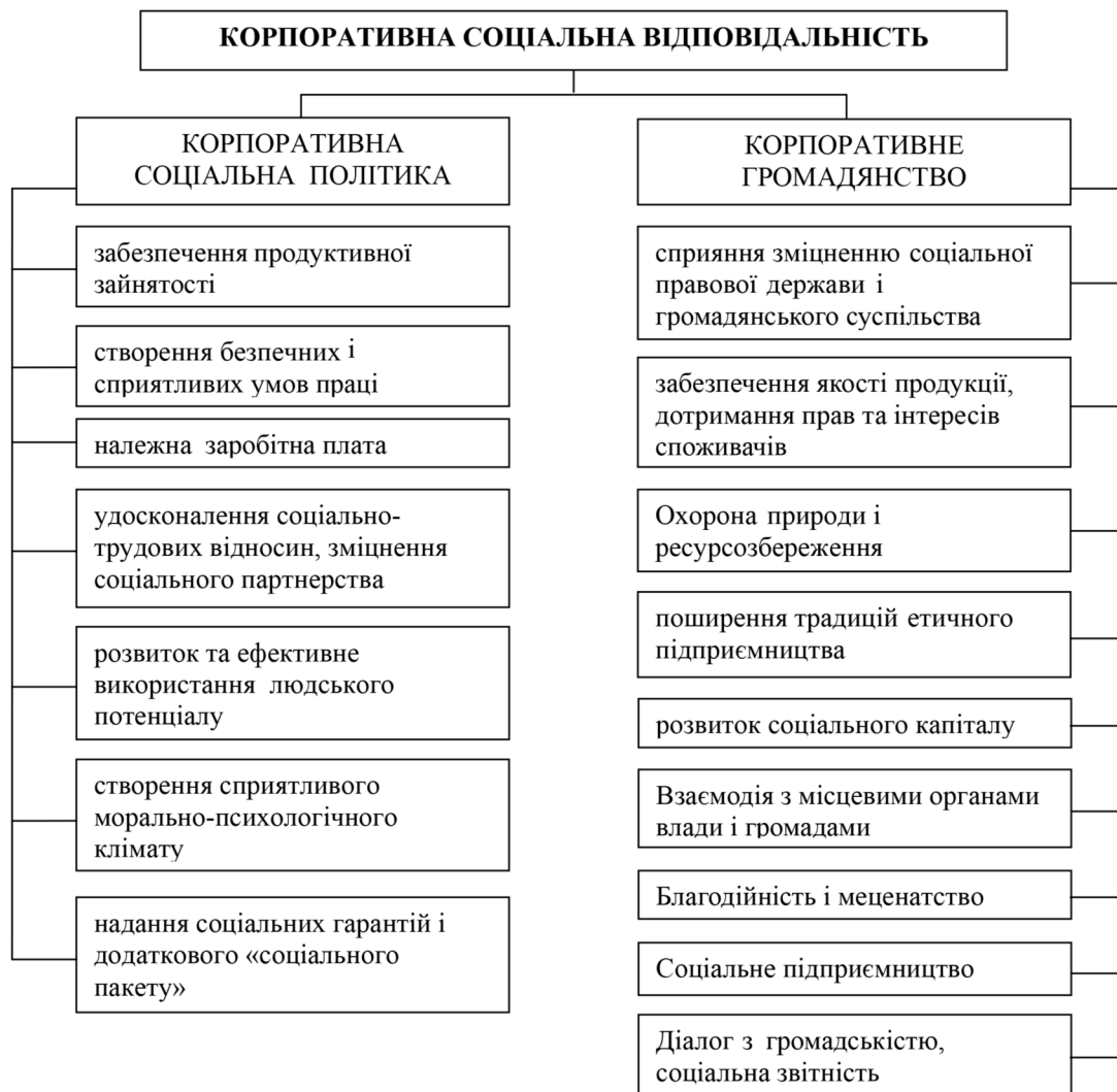
Рис. 1. Пріоритетні напрями реалізації корпоративної соціальної відповідальності