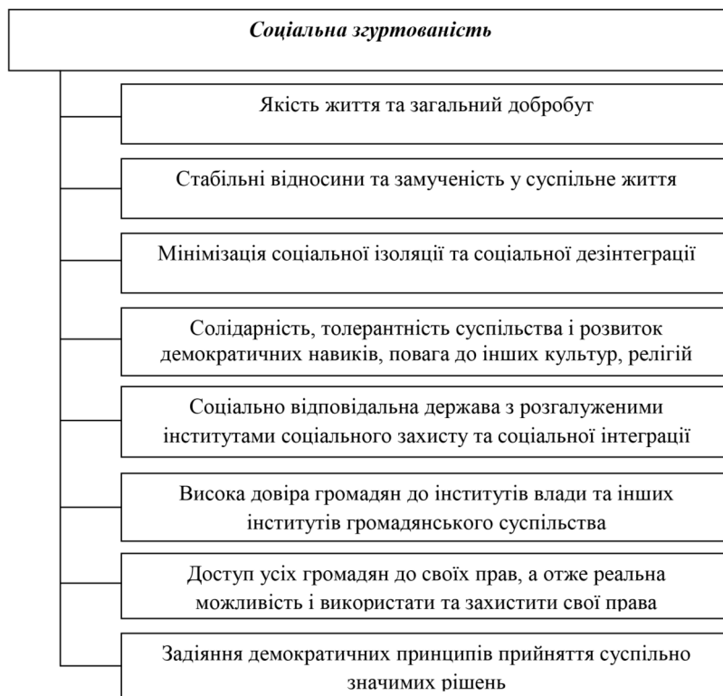
Рис. 1. Основні складові соціальної згуртованості згідно розробленої та оновленої в ЄС Стратегії соціальної згуртованості (2007 р.)

➤ середземноморська – корпоративна, заснована на традиціях (велике значення сім’ї).