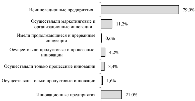
Рис. 2. Распределение предприятий Украины по типам инновационной деятельности, % ко всем предприятиям [6, с. 254]

Государственную поддержку для осуществления инновационной деятельности в период с 2008 по 2010 г. получали лишь 3,7% от общего количества предприятий с технологическими инновациями (табл. 1). При этом значительная ее часть была предназначена для предприятий по производству и распределению электроэнергии, газа и воды.