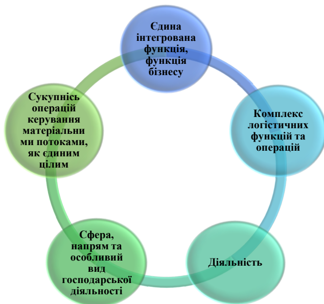
Рис. 4. Ключові аспекти поняття «логістична діяльність»

При тлумаченні дефініції вчені виділяють наступні ключові поняття (рис. 4).