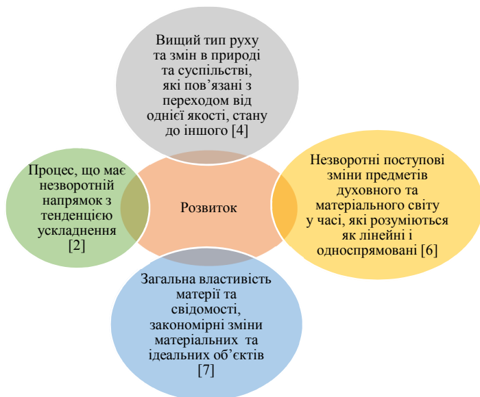
Рис. 1 Філософське тлумачення терміну «розвиток»

Підсумовуючи наведене і з огляду на те, що «розвиток» є фундаментальною філософською категорією на рис. 1 представлені філософські тлумачення цього терміну з метою формування всебічного розуміння цього поняття.