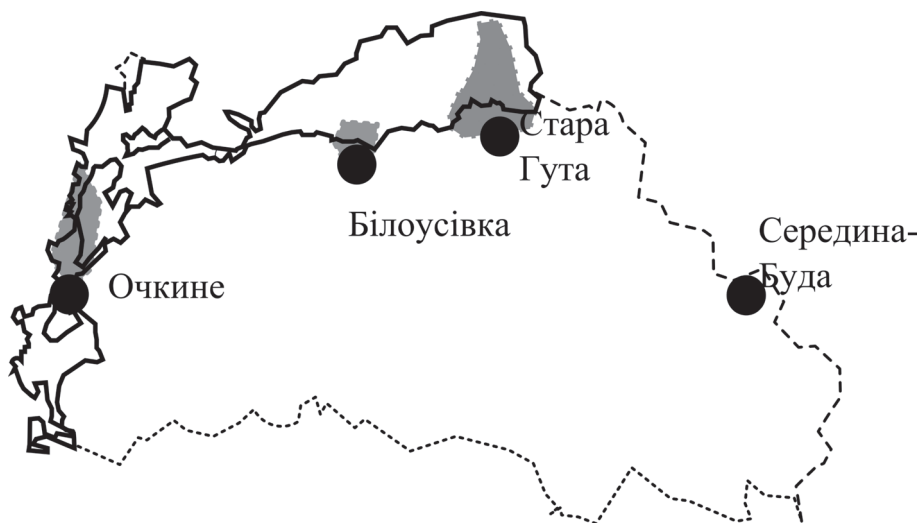
Рис. 1. Схема району досліджень (суцільною лінією позначені межі парку, пунктирною — межі Середино-Будського району, переривчастою — кордон України, сірим кольором — території досліджень).