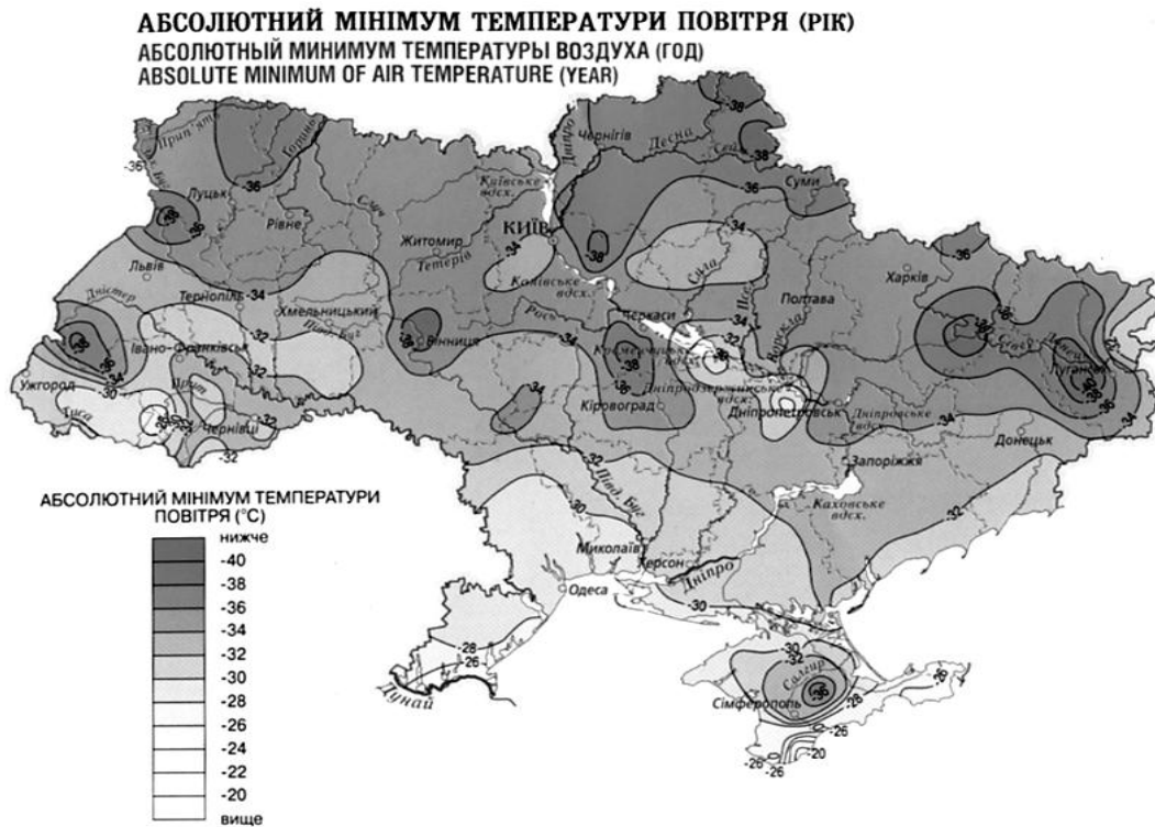
Рис. 5. Абсолютный годовой минимум температуры воздуха на Украине за период инструментальных измерений (Национальный атлас Украины, 1999-2000).

Fig. 5. Absolute annual minimum temperature in Ukraine in the period of instrumental measurements.