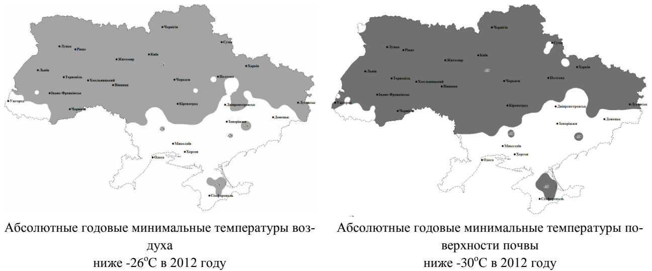
Рис. 3. Абсолютные минимальные температуры воздуха и почвы в 2012 году на Украине (Метеорологічні щорічники..., 1951-2014).

Fig. 3. The absolute minimum of air temperature and soil in 2012 in Ukraine.