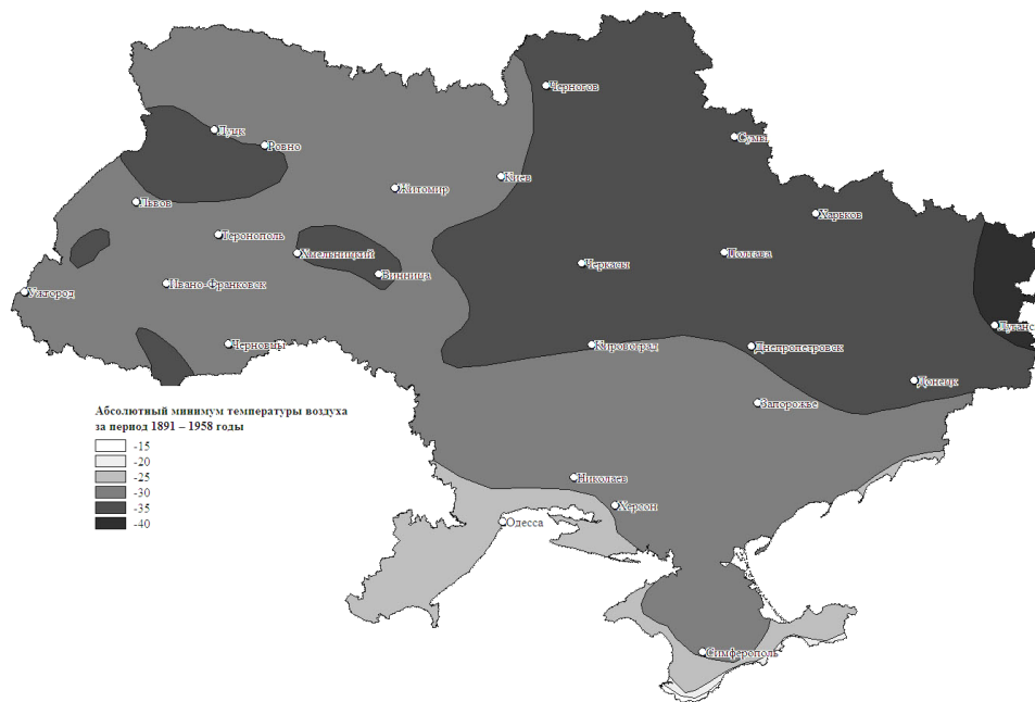
Рис. 1. Абсолютная минимальная температура воздуха в начальный период заселения АББ в Украине (Климатический атлас Украинской ССР, 1968).

Fig. 1. The absolute minimum of air temperature during the initial period of settlement of Hyphantria cunea in Ukraine (Climatic Atlas of the Ukrainian SSR, 1968).