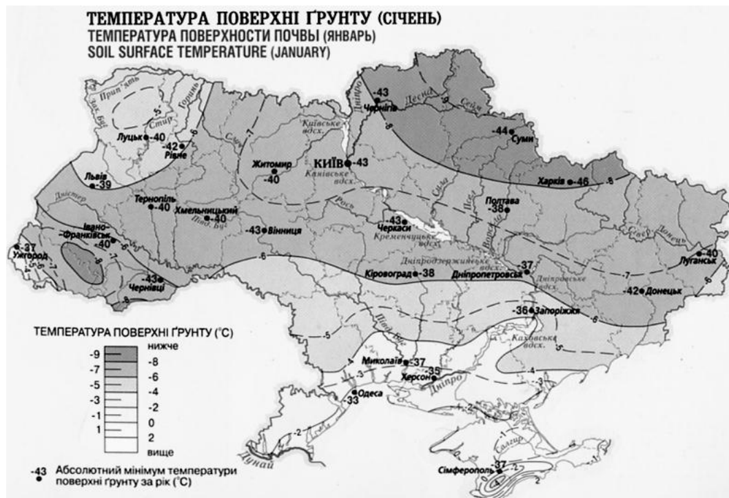
Рис. 6. Абсолютный годовой минимум температуры поверхности почвы на Украине за период инструментальных измерений (Национальный атлас Украины, 1999-2000).

Fig. 5. Absolute annual minimum temperature in Ukraine in the period of instrumental measurements.