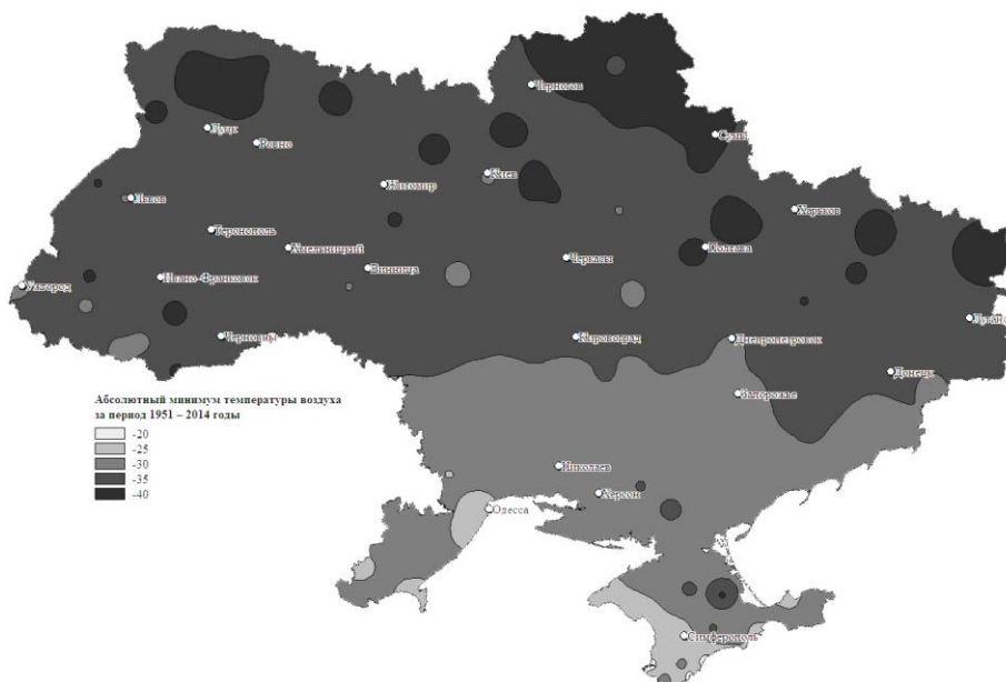
Рис. 2. Абсолютная минимальная температура воздуха к современному периоду расселения АББ на Украине (Метеорологічні щорічники, випуск 10, таблиця 1).

Fig. 1. The absolute minimum of air temperature during the initial period of settlement of Hyphantria cunea in Ukraine (Climatic Atlas of the Ukrainian SSR, 1968).