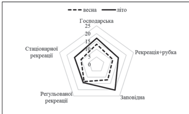
Рис. 2. Індекс різноманіття Маргалефа ( D_{Mg} ), розрахований за даними весняних і літніх обліків твердокрилих на ділянках із різними режимами господарювання та рівнями антропогенного навантаження у НПП «Гомільшанські ліси»

Fig. 2. Margalef diversity index evaluated by spring and summer assessment of beetles in the plots with different management regimes and levels of anthropogenic load in the National nature park “Gomilshansky lisy”