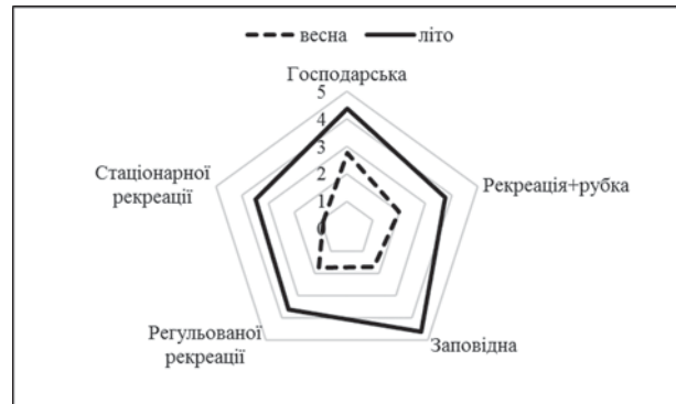
Рис. 3. Індекс різноманіття Менхініка, розрахований за даними весняних і літніх обліків твердокрилих на ділянках із різними режимами господарювання та рівнями антропогенного навантаження у НПП «Гомільшанські ліси»

Fig. 2. Margalef diversity index evaluated by spring and summer assessment of beetles in the plots with different management regimes and levels of anthropogenic load in the National nature park “Gomilshansky lisy”