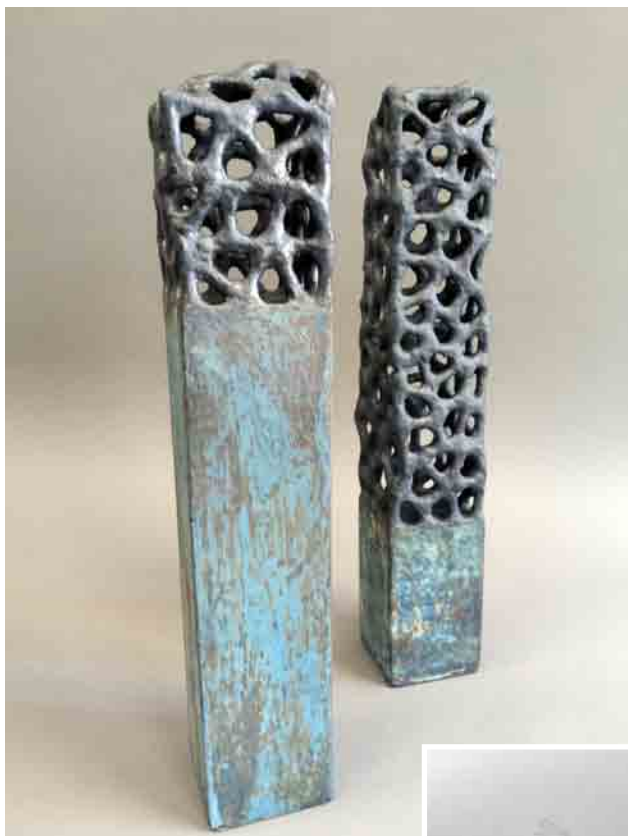
Ю. Мусатов. Вежі I і II. Шамот, кольорові маси, оксид міді. Авторська техніка. 2014 р.