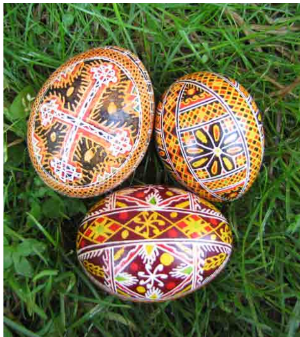
А. Шатрук. Писанки. Розпис воском. с. Снідавка Косівського р-ну Івано-Франківської обл. 1990-ті рр.

Про підготовку до роботи майстриня уточнює, що руки і яєчко мають бути чистими, «не масними, бо за масне не візьмешся». Фарби використовувала завжди куповані, жовто-лимонну по-місцевому називає «кукурудзовою», оранжеву, як на тигровій лілії, – жовтою.